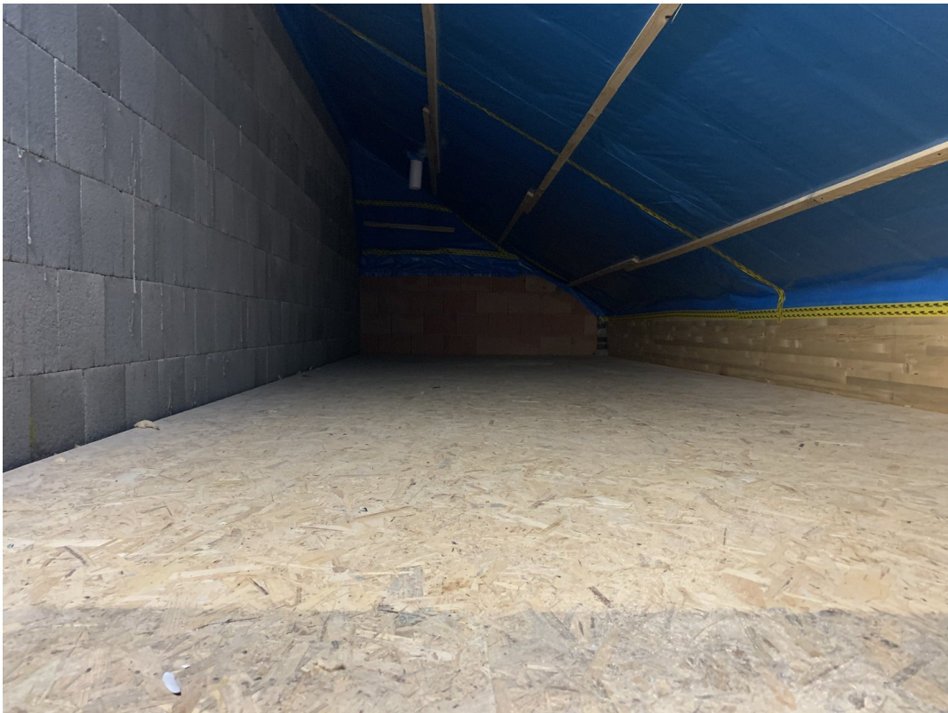
Speicher rechte Seite