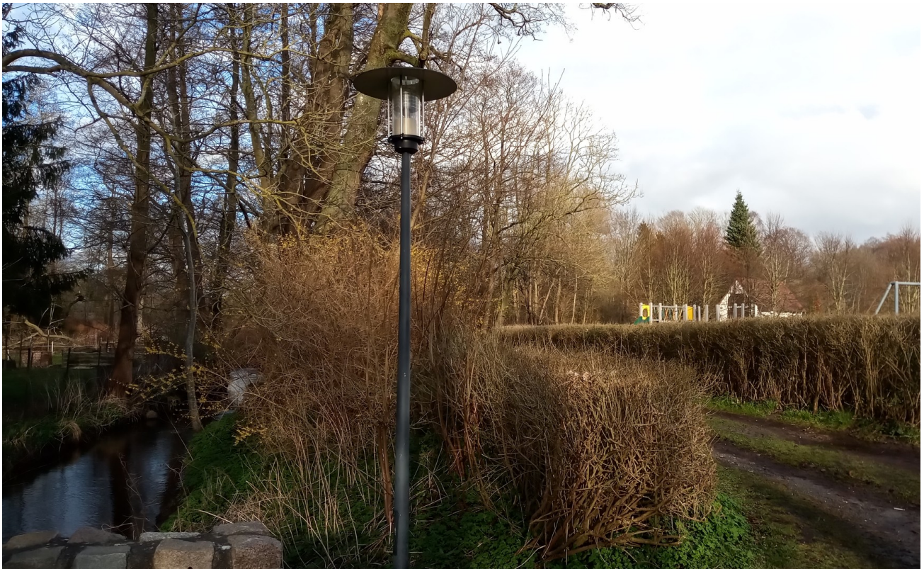
direkt angrenzender Spielplatz