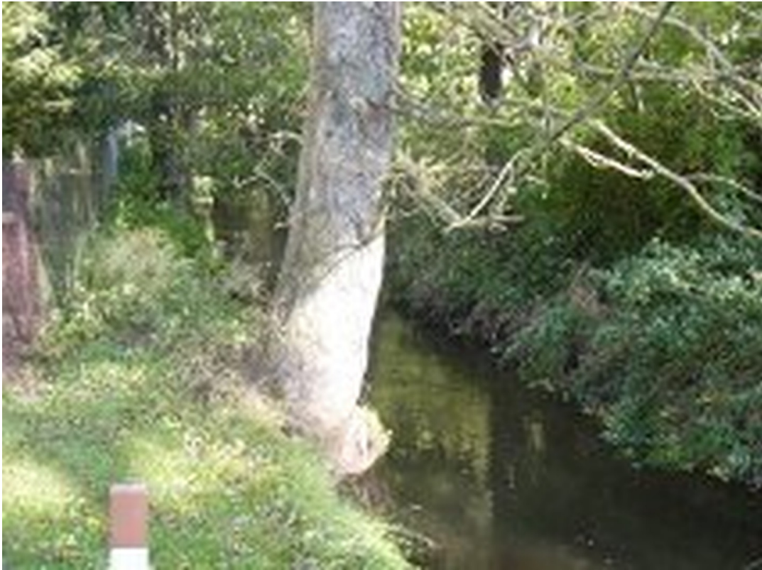
Bachlauf am Grundstück