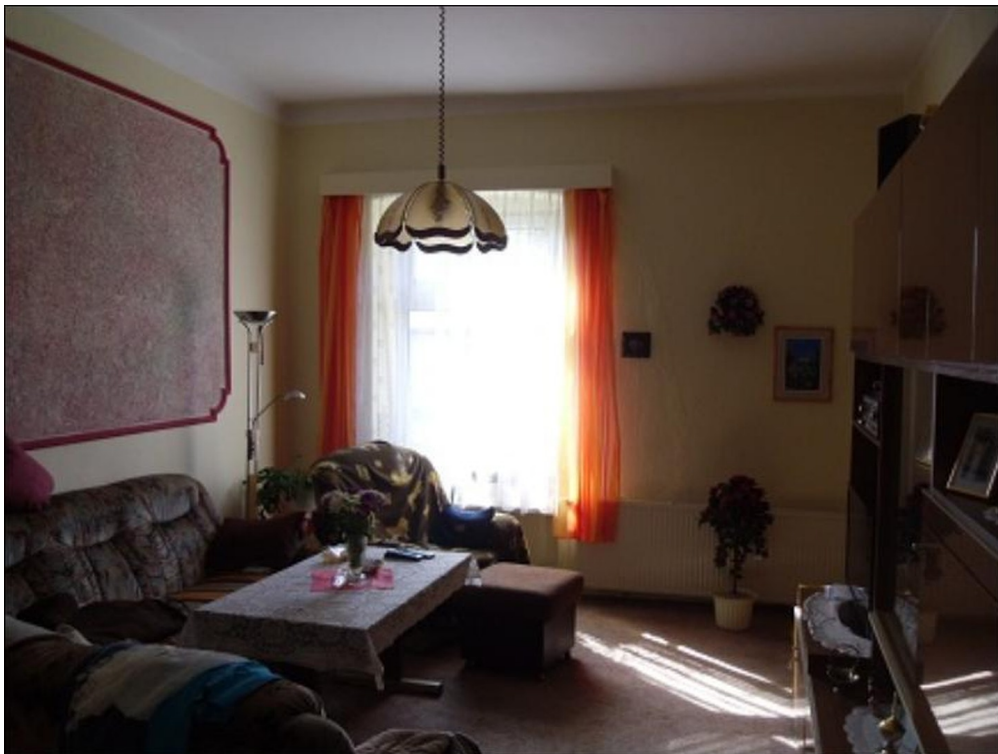
Wohnung EG rechts, vor Renov.