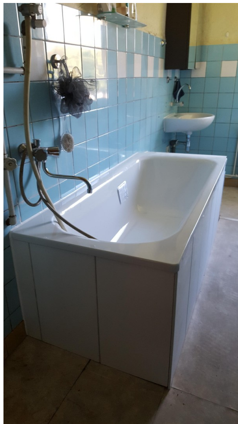
neue Wanne EG rechts