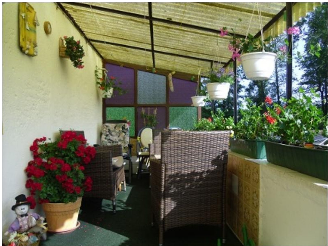
Eingang Wohnung EG rechts