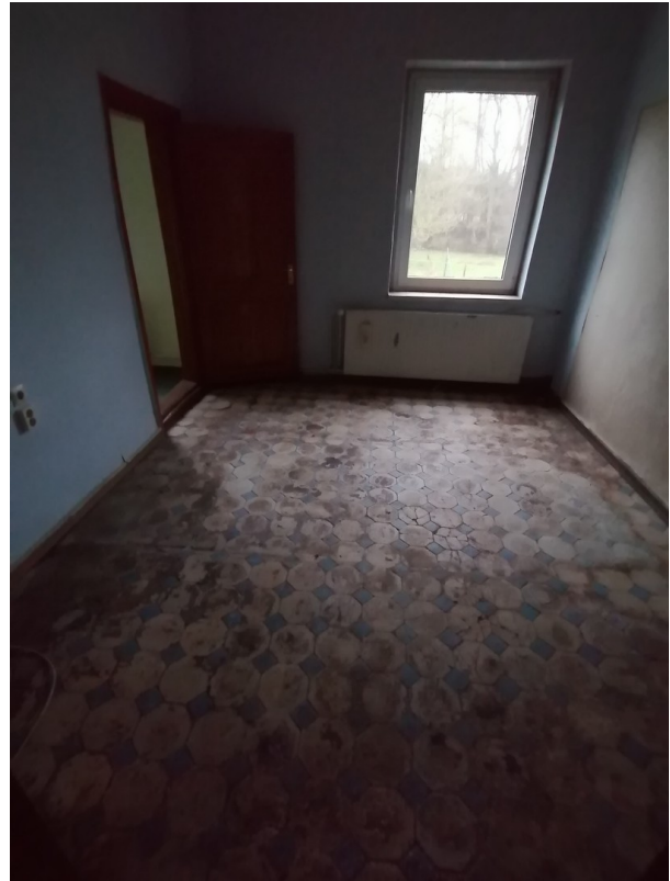
Zimmer 4,EG rechts, vor Renov.