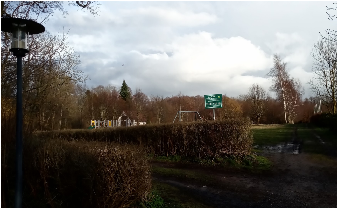
direkt angrenzender Spielplatz