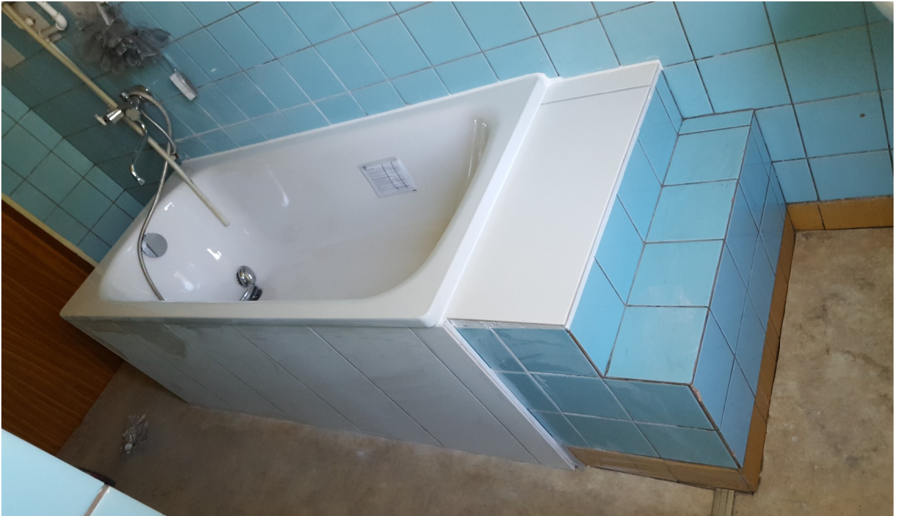
neue Wanne EG rechts