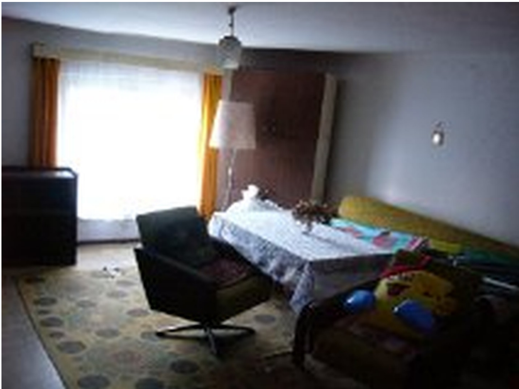
ehemaliges Wohnzimmer im 1.OG