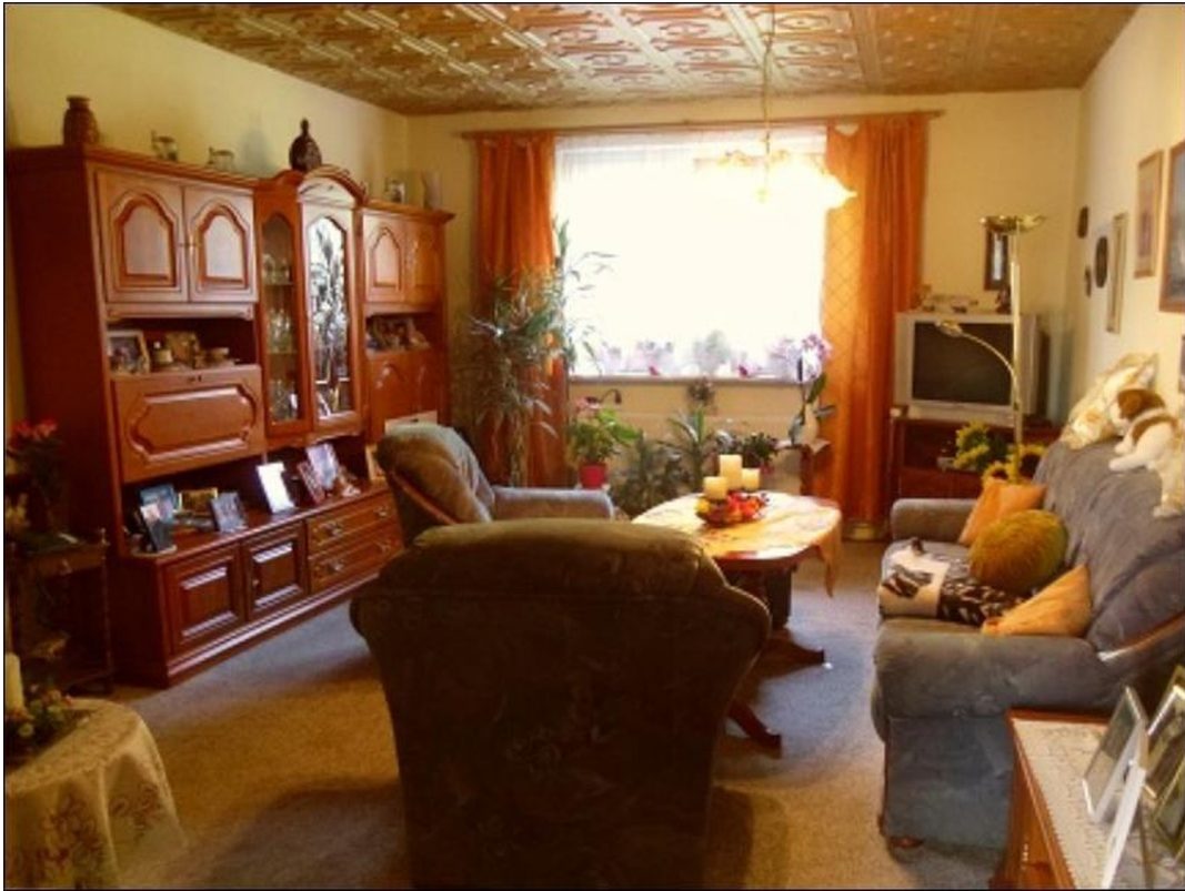
Wohnung EG links