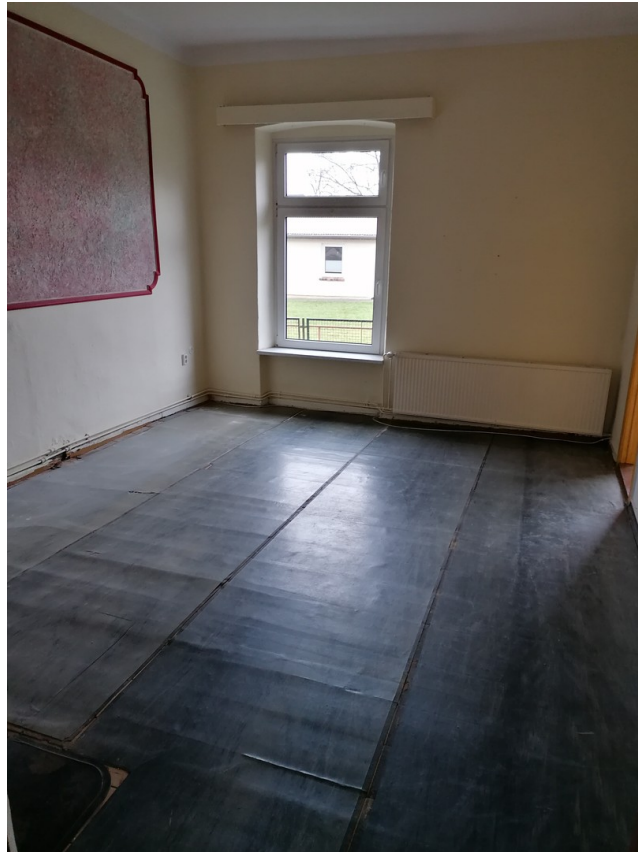
Zimmer 2,EG rechts, vor Renov.