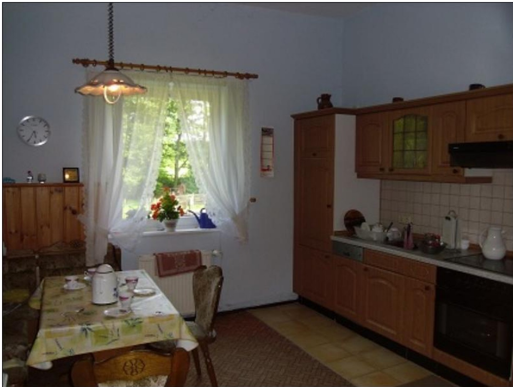
Küche EG rechts, vor Renov.