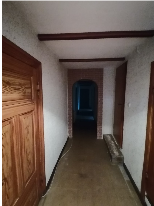
Flur, Wohnung EG rechts