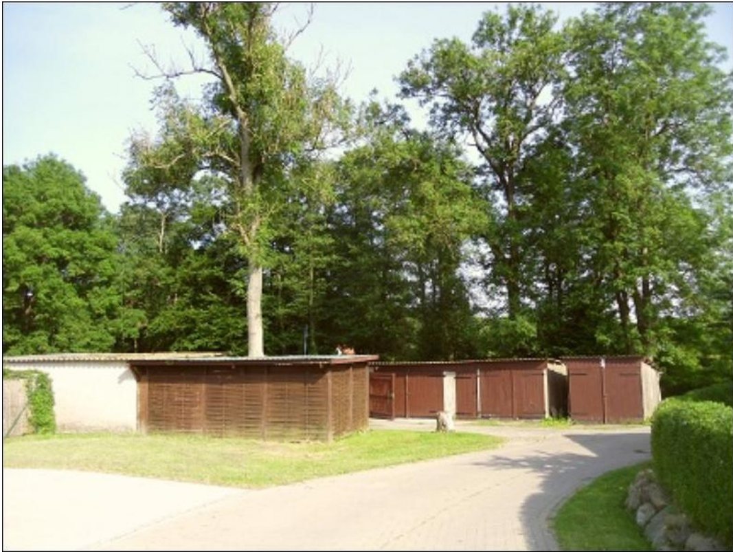
Garagen und Schuppen im Garten