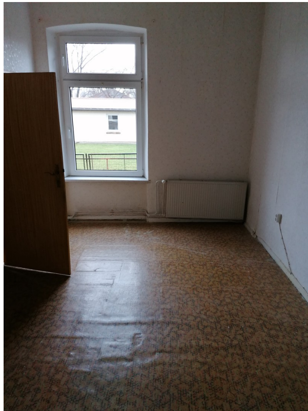
Zimmer 3,EG rechts, vor Renov.