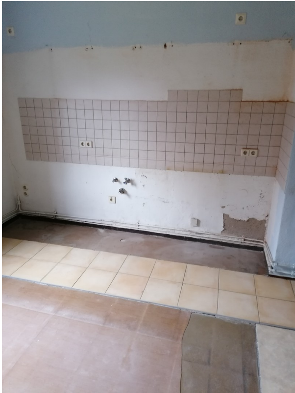
Küche,EG rechts, vor Renov.