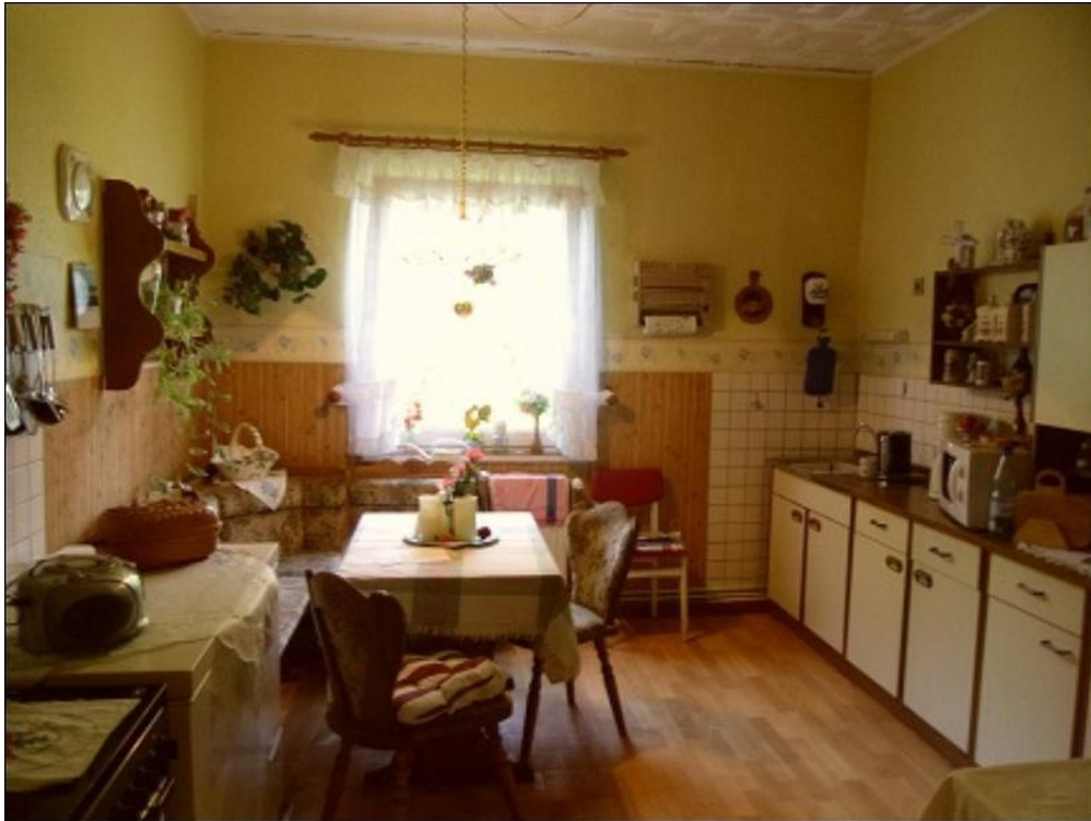
Küche EG links