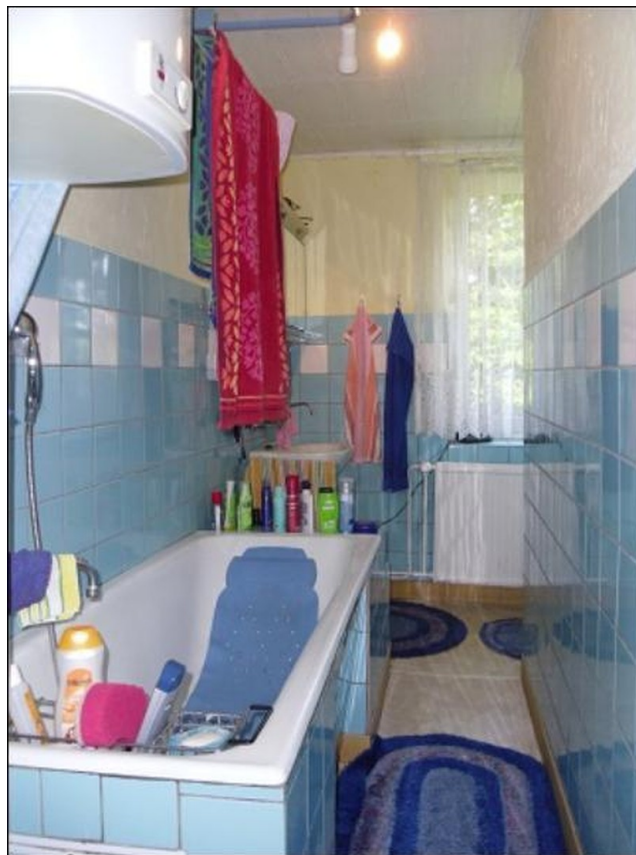
Bad EG rechts