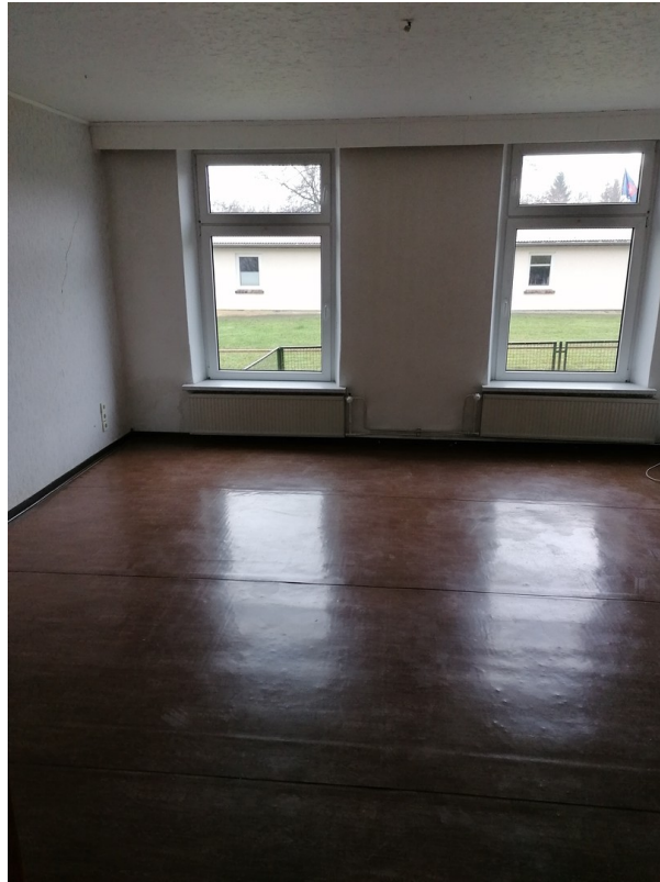
Zimmer 1,EG rechts, vor Renov.