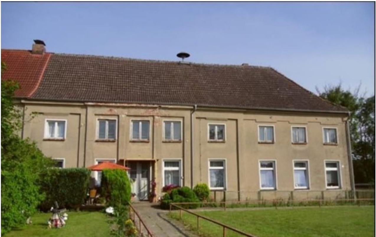
Ansicht, ehemaliges Gutshaus