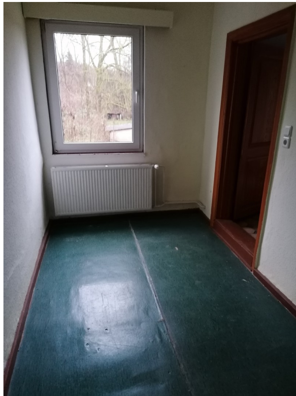
Flur, EG rechts