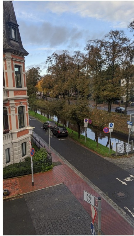
Blick aus dem Wohnzimmer