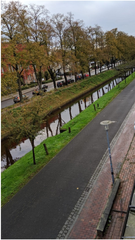
Blick aus dem Wohnzimmer