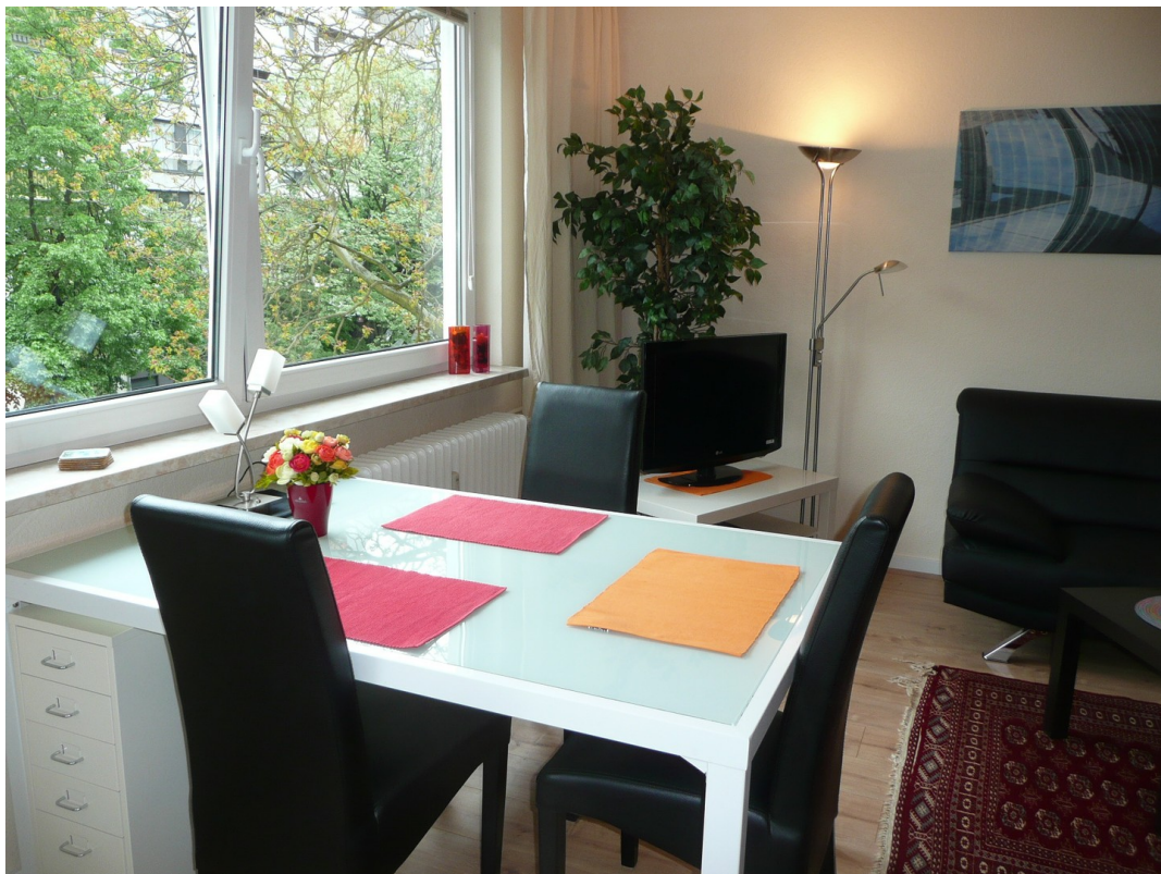
Tisch 1,80 x 0,60 m