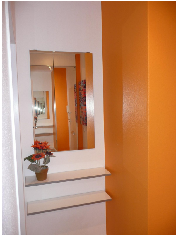
Flur mit Spiegel und Ablage