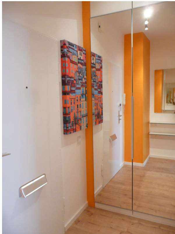
Flur mit Spiegelschrank