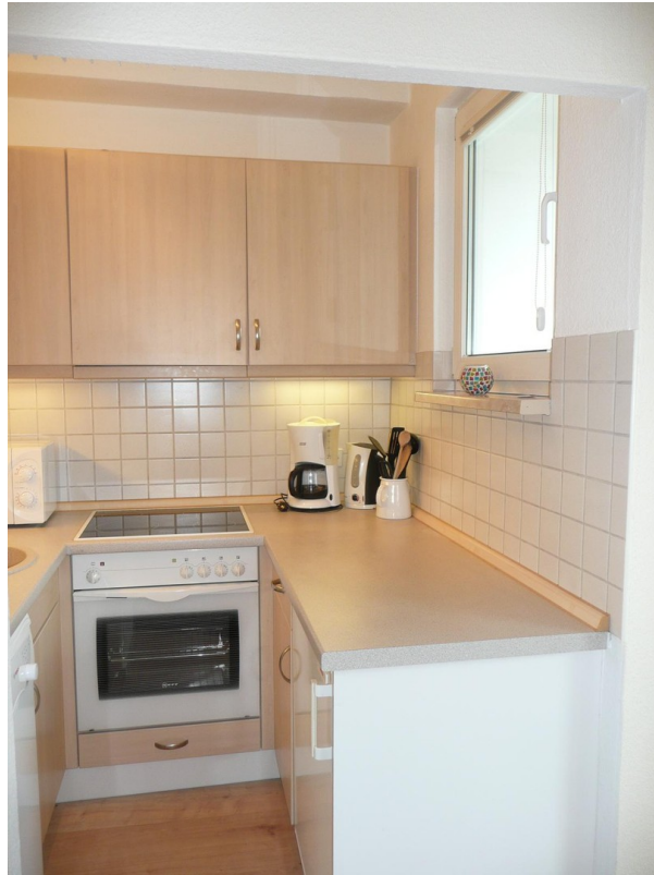
Einbauküche mit Fenster