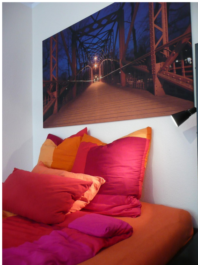
Bett 1,80 x 2,00 m