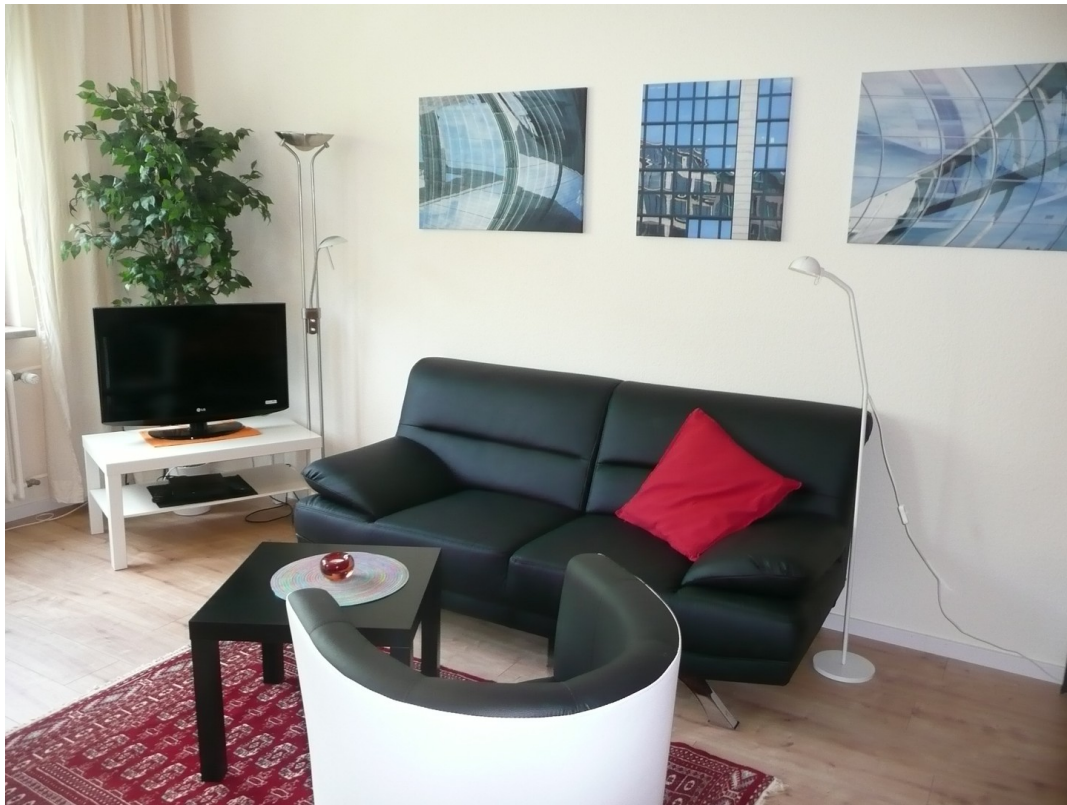
TV, Couch & Coktailsessel