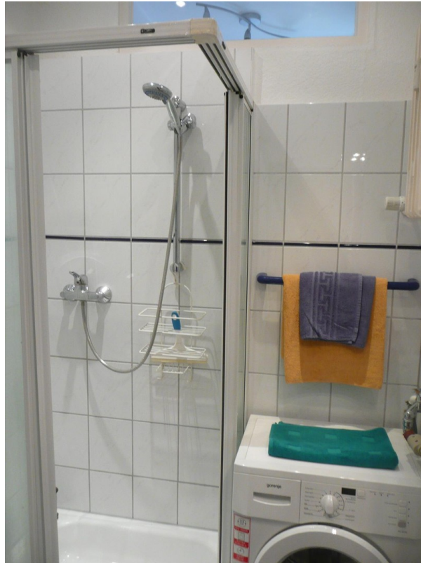
Duschbad mit Oberlichtfenster