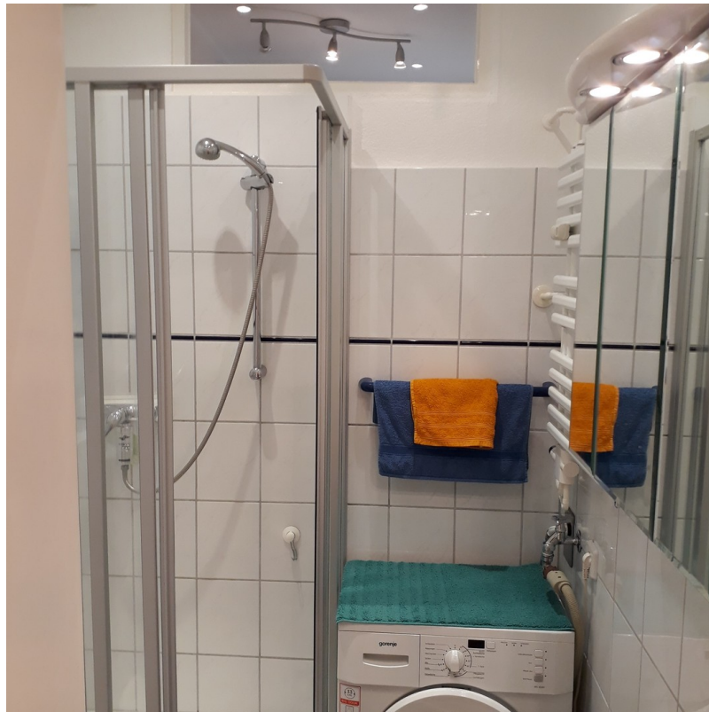
Duschbad mit Waschmaschine