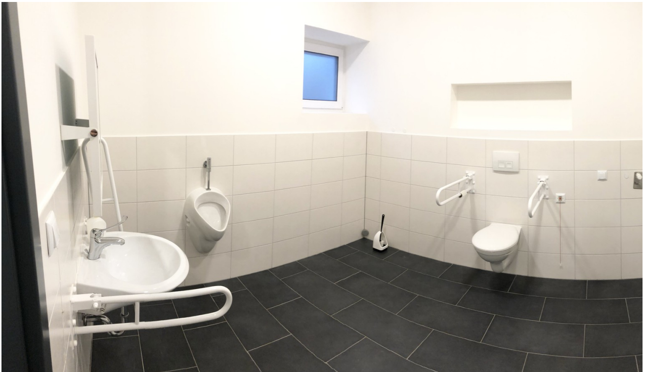
Wc im EG Barrierefrei