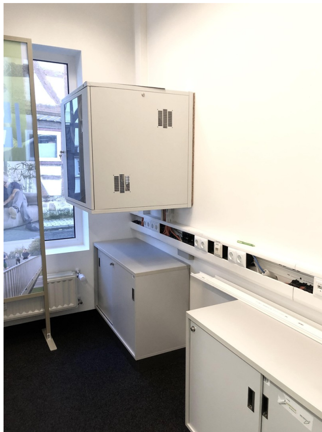
Technikraum inkl Serverschrank