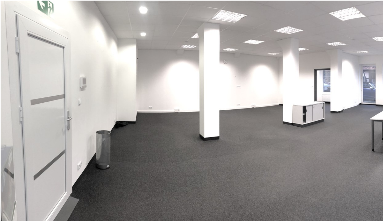
Bürofläche im EG