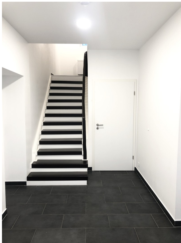
Flur / Treppenhaus