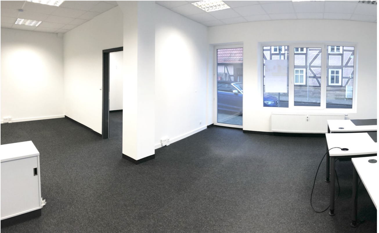
Bürofläche im EG