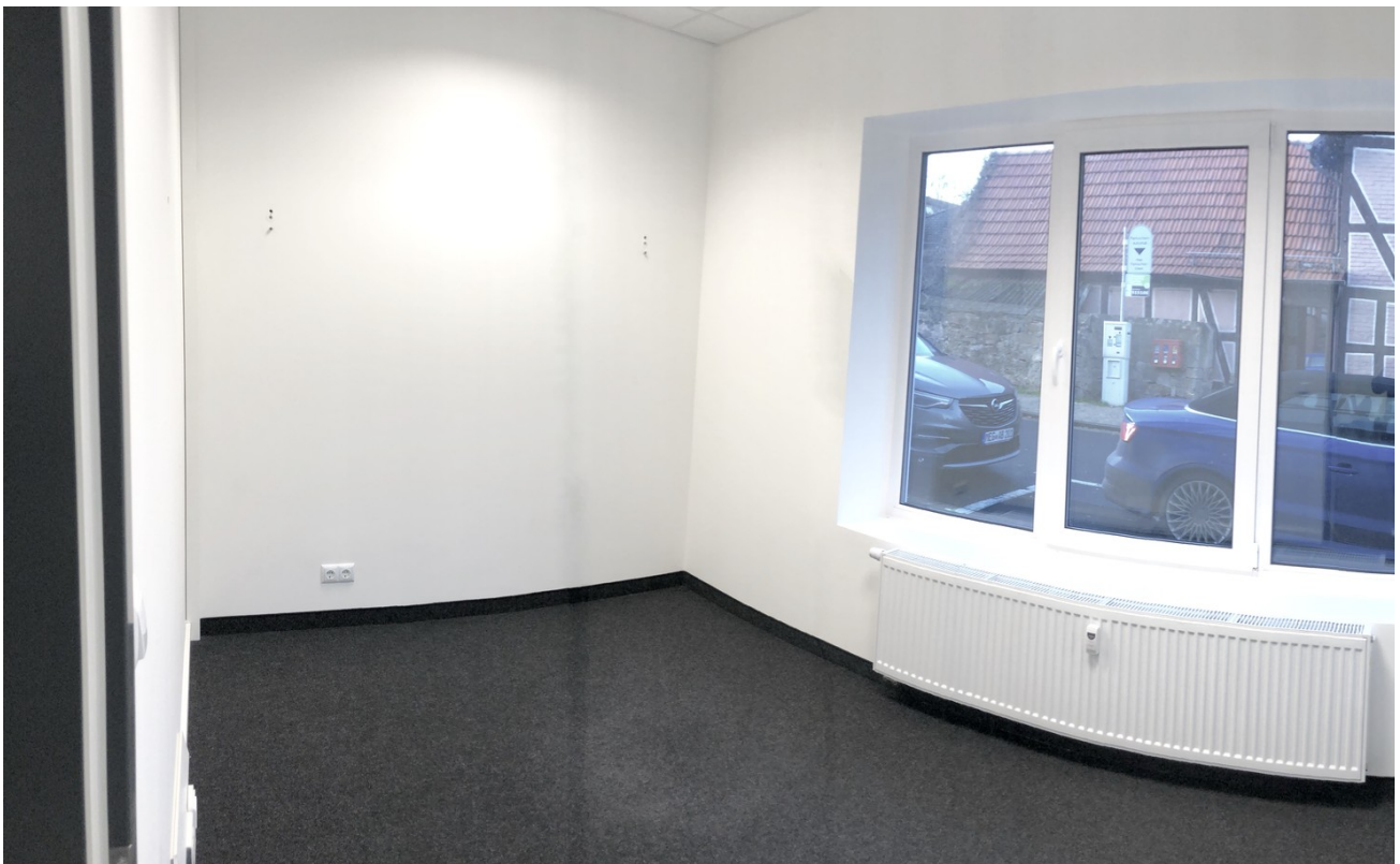
Bürofläche im EG