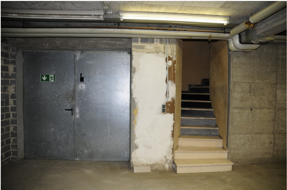
Einfahrt Hobby Raum