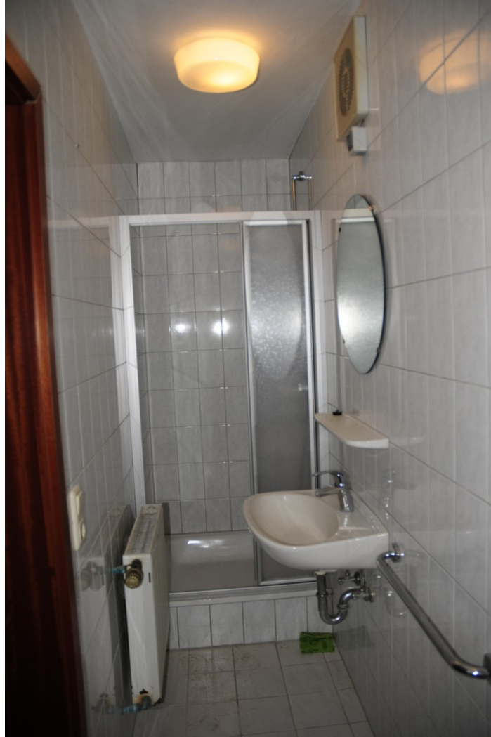
Dusche WC Keller