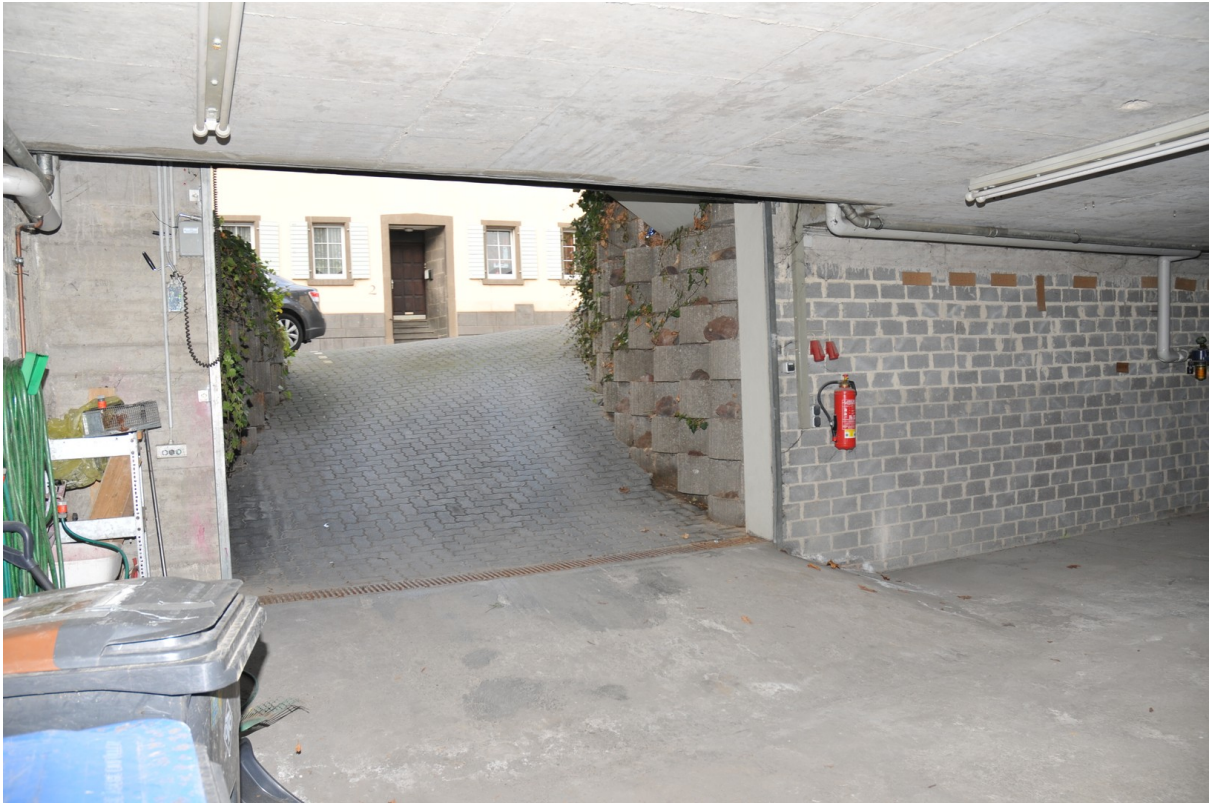
Ein/ Ausfahrtzuab Saunststr.1