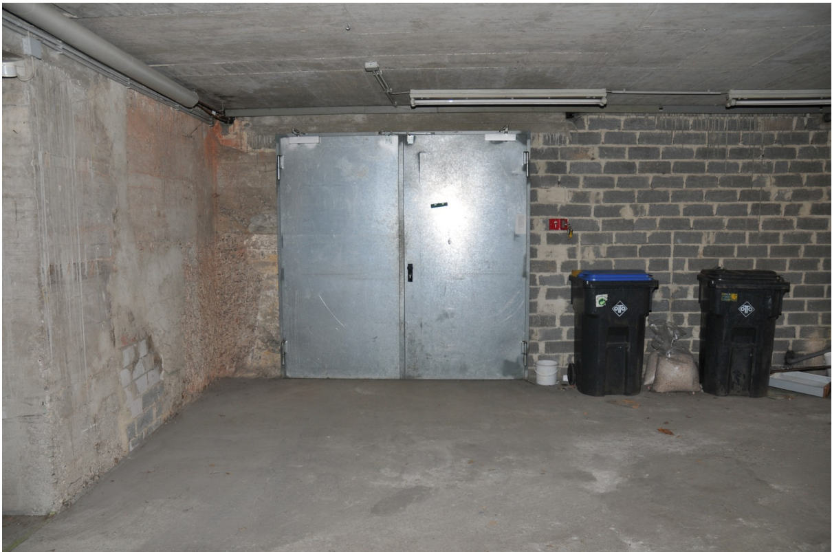
Zufahrt -Eingang HobbyTiefgar