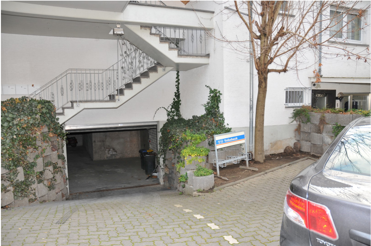
Abfahrt zum Hobby Raum