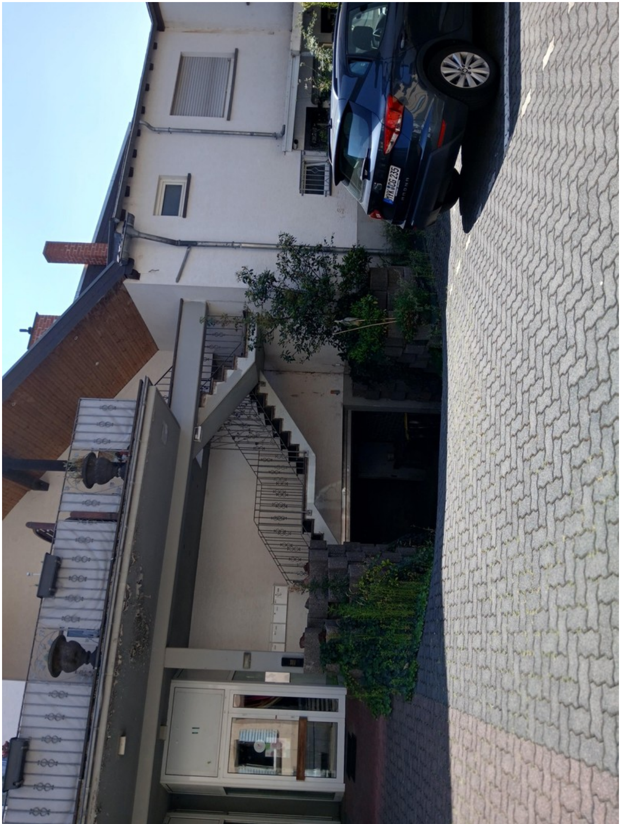
8Parkplätze z an der Saunstl u