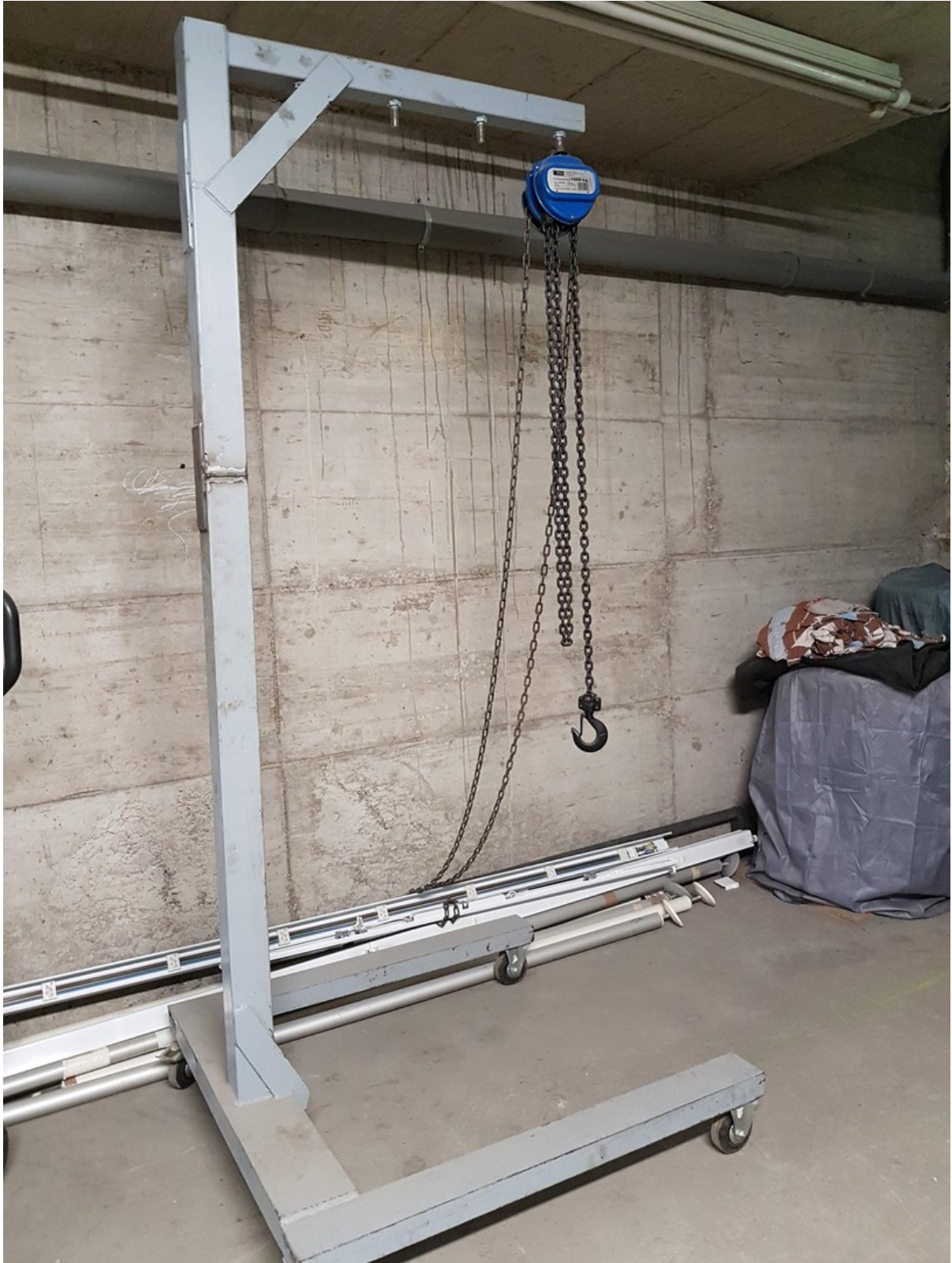
Hand -Demag zug zumHobbyraum