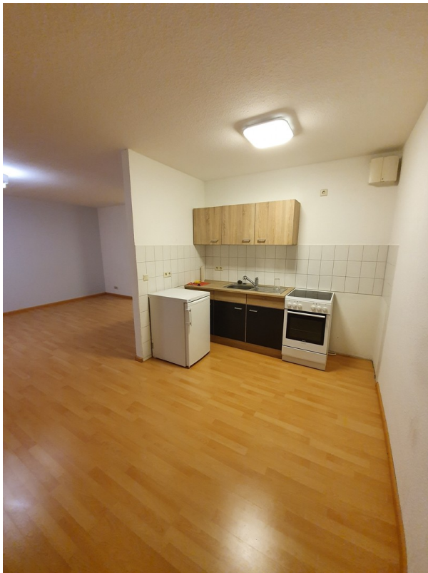
Küche / Essbereich