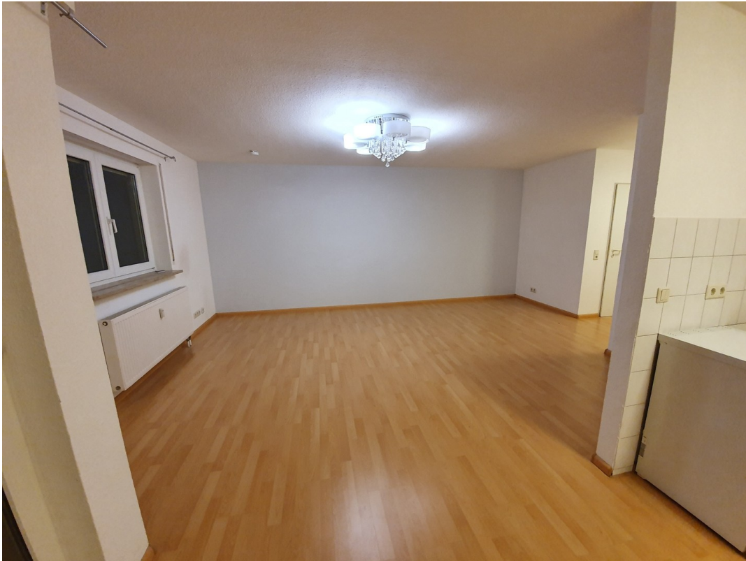
Küche / Wohnzimmer