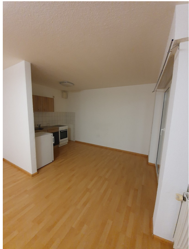
Wohnzimmer / Küche