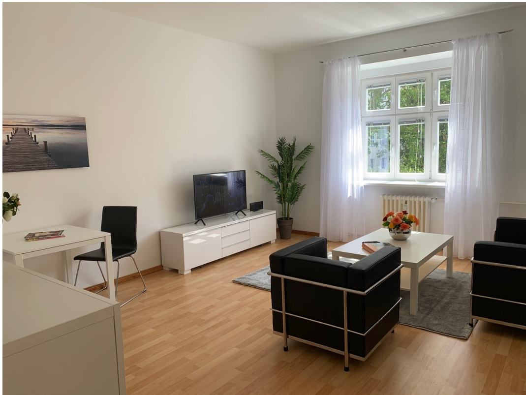
Wohnzimmer vom Flur