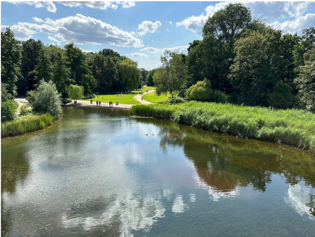
Schöneberger Park nur 3min