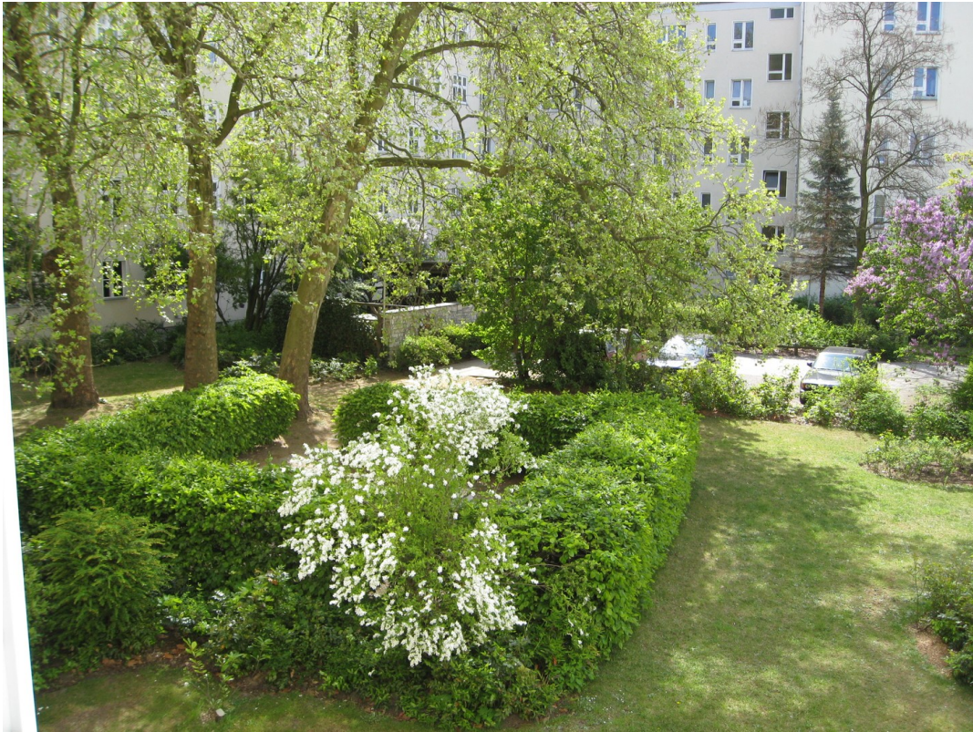
Blick aus dem Wohnzimmer