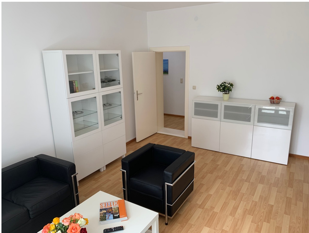
Wohnzimmer zum Flur