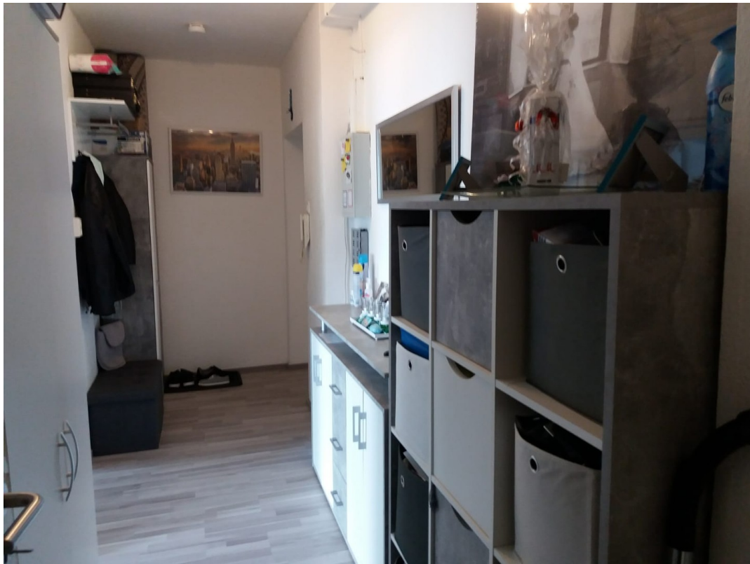
Flur nach außen