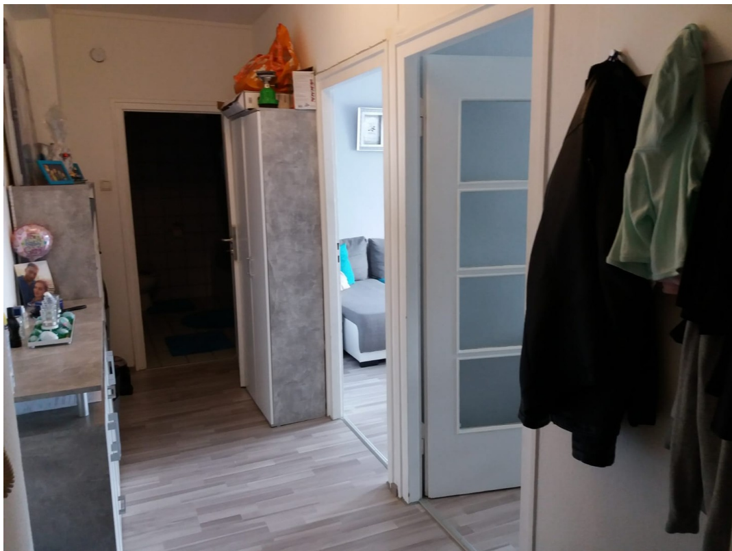
Flur nach innen