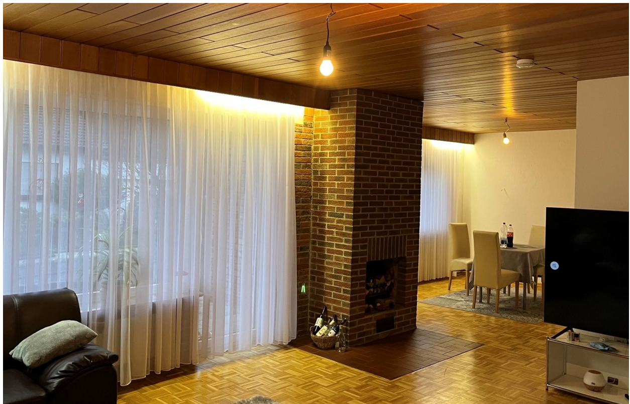
Wohn / Esszimmer