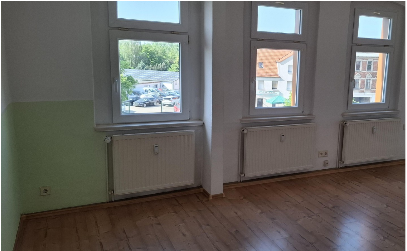
Wohnzimmer im DG