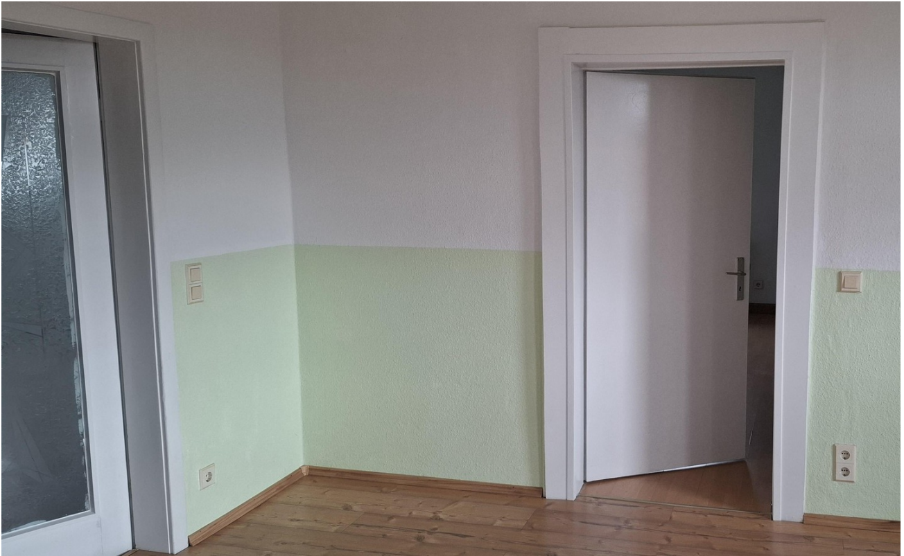
Zugang zm Schlafzimmer