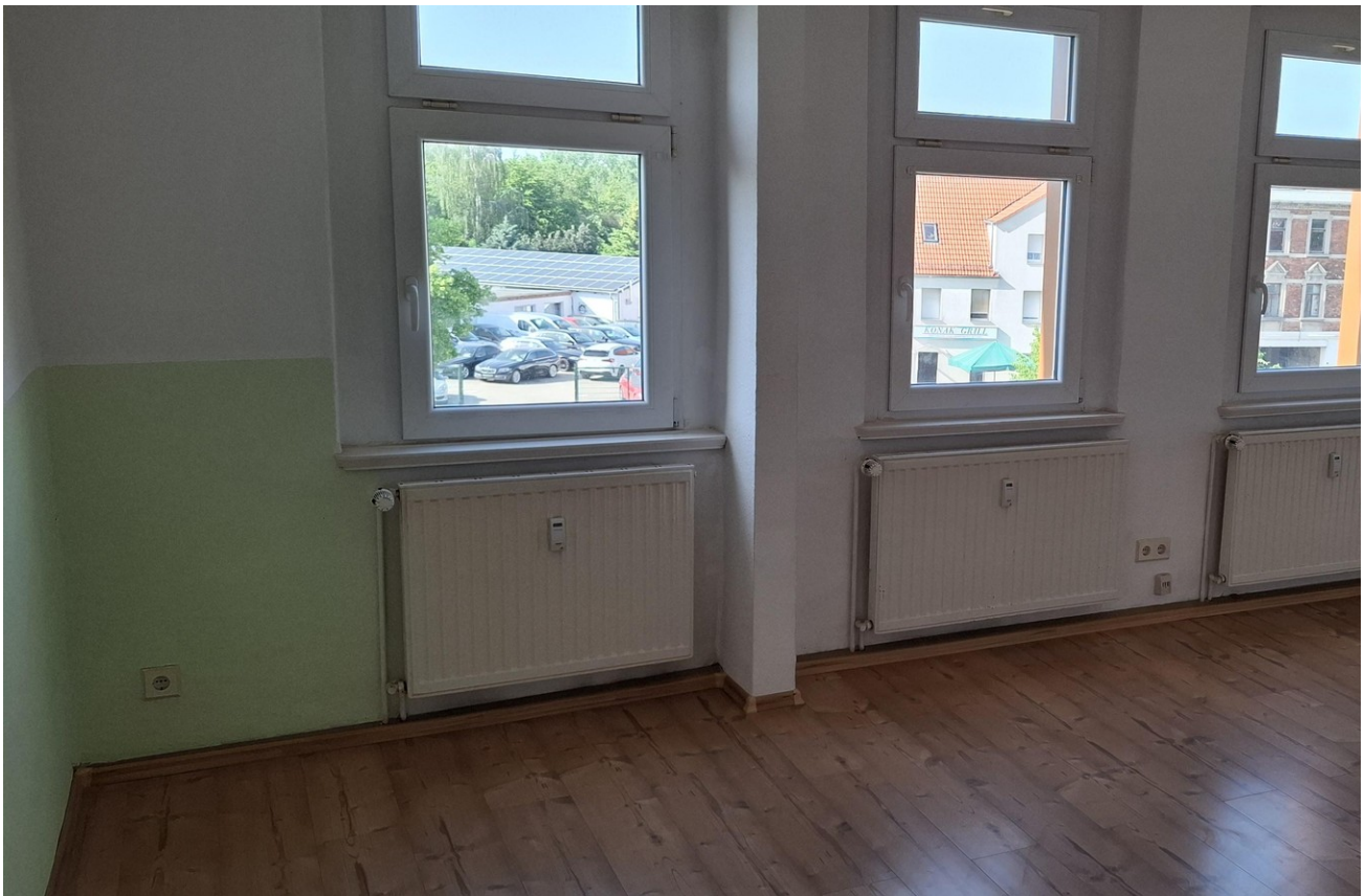
Wohnzimmer im DG