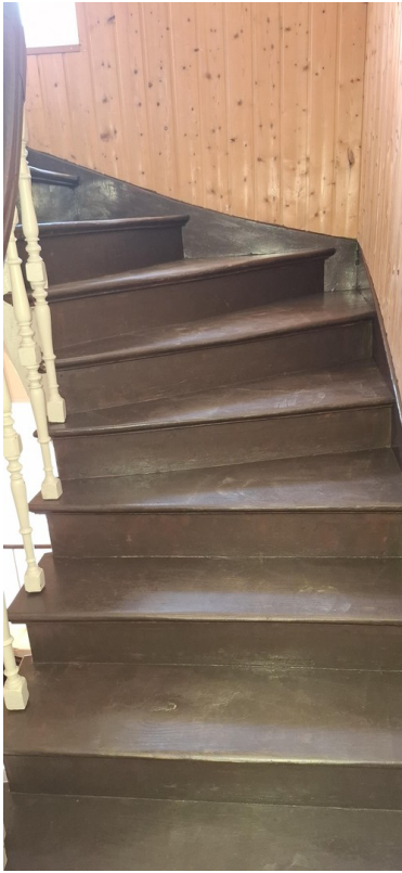
Treppenaufgang zum DG