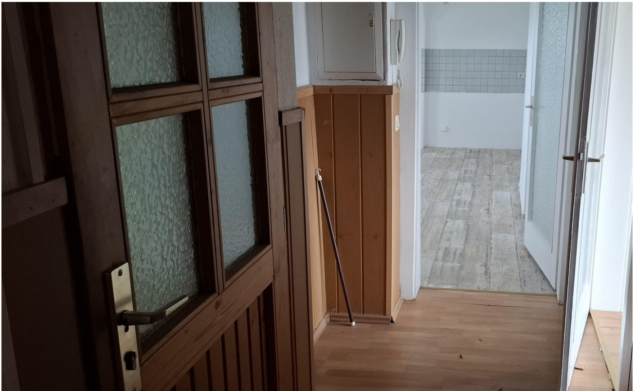
Flur zur Küche