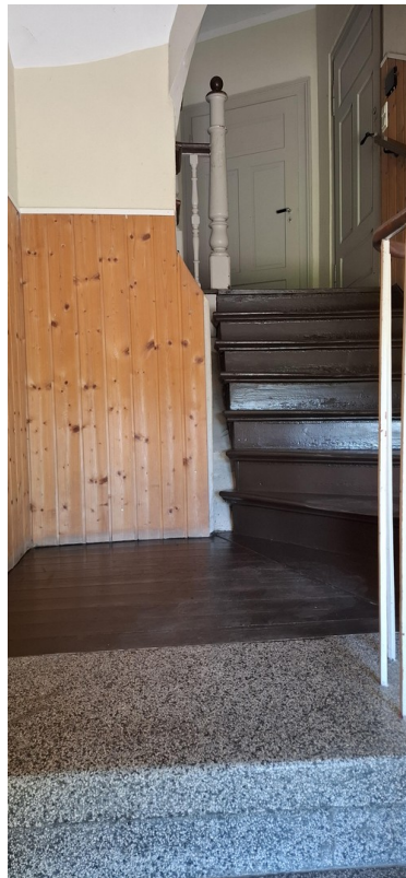
Treppenaufgang zum 1. OG