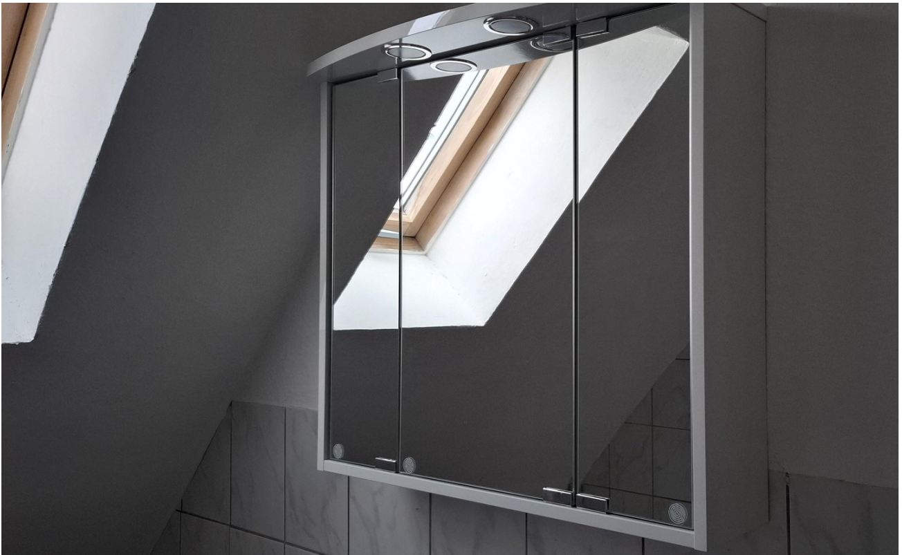
Spiegelschrank im Bad