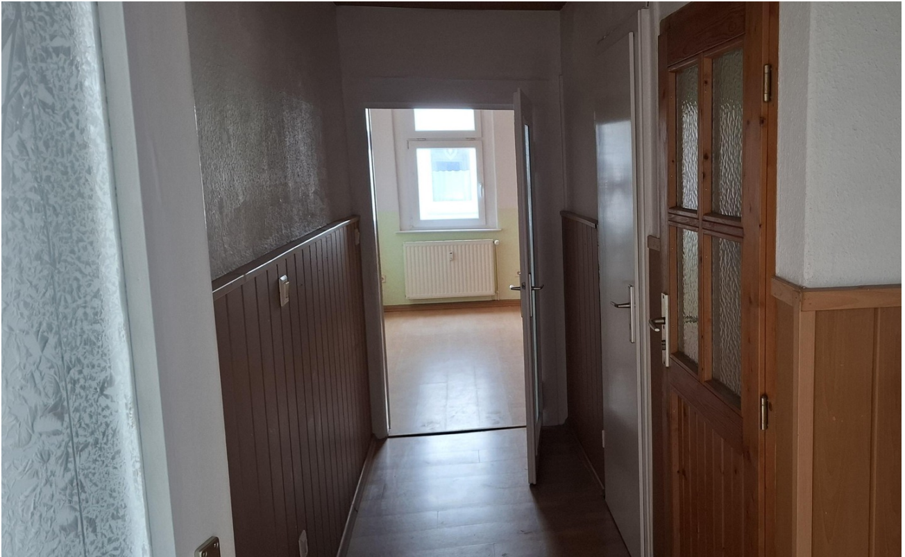
Flur zu Kinderzimmer