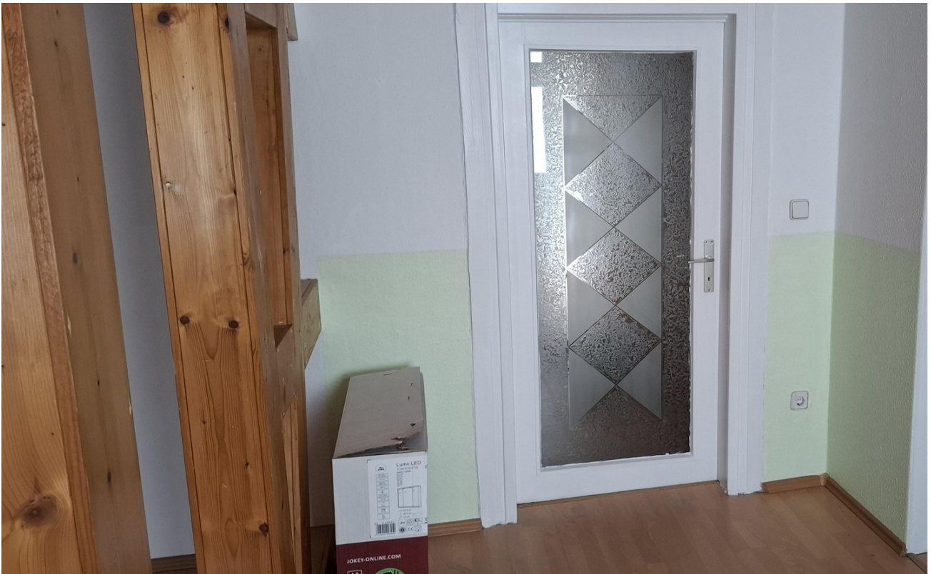
Zugang zu den Kinderzimmer