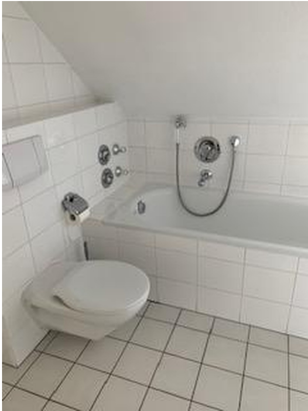
Bad mit Badewanne und Dusche