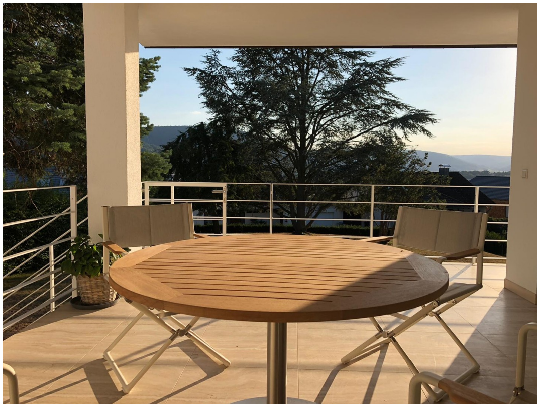
Balkon mit Außenkamin