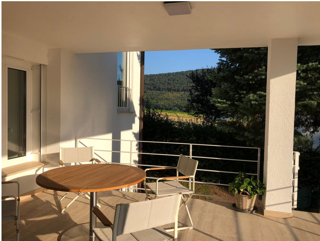
Balkon mit Außenkamin