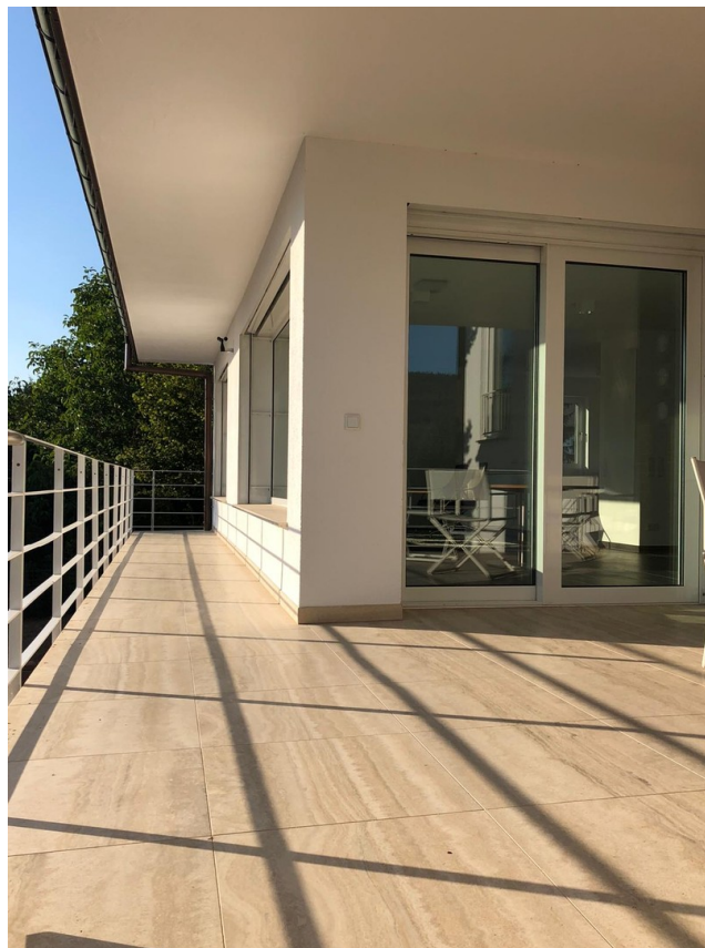
Balkon mit Außenkamin