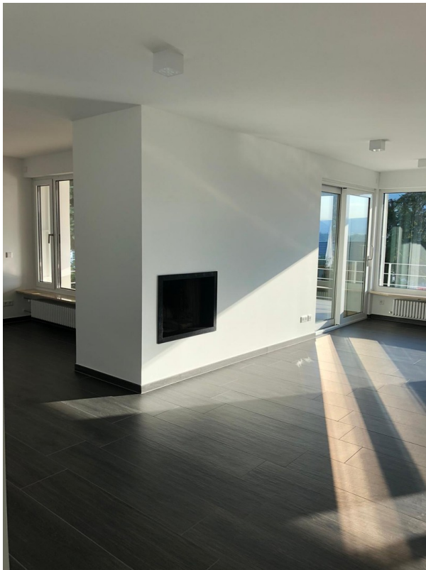
Wohnzimmer mit Kamin