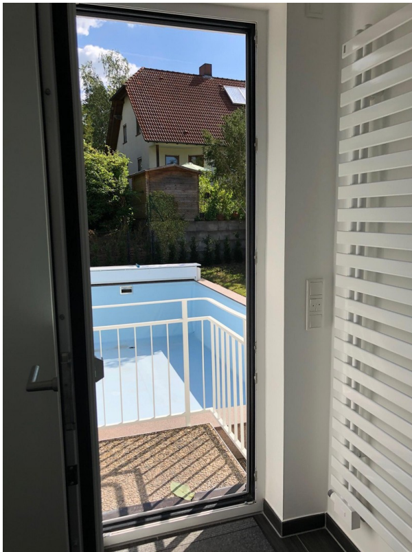
Bad - Zugang zum Schwimmbad