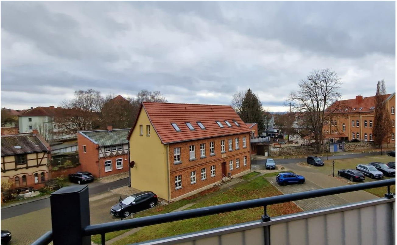
Ausblick in die Anlage