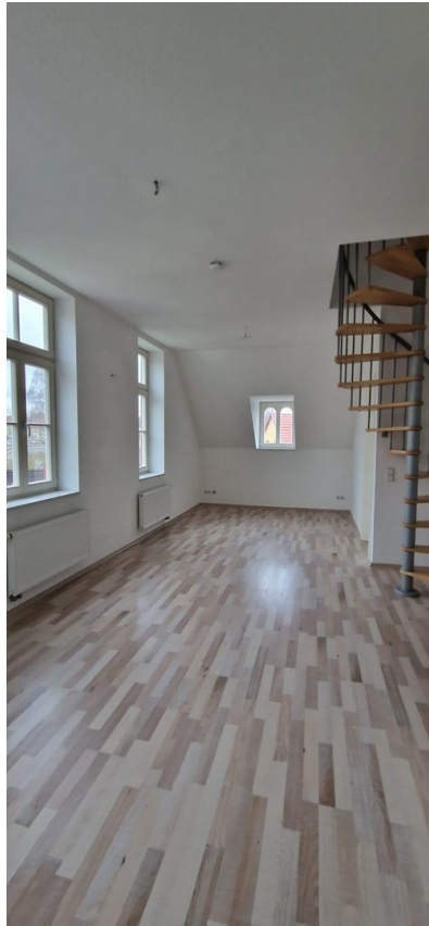
Wohn / Esszimmer