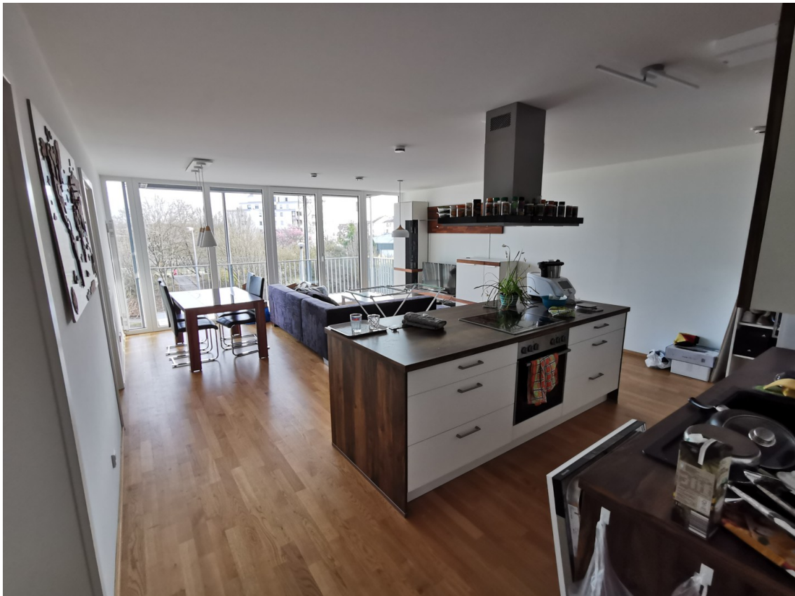
Kochen, Essen und Wohnen