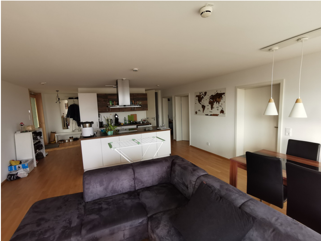
Kochen, Essen und Wohnen