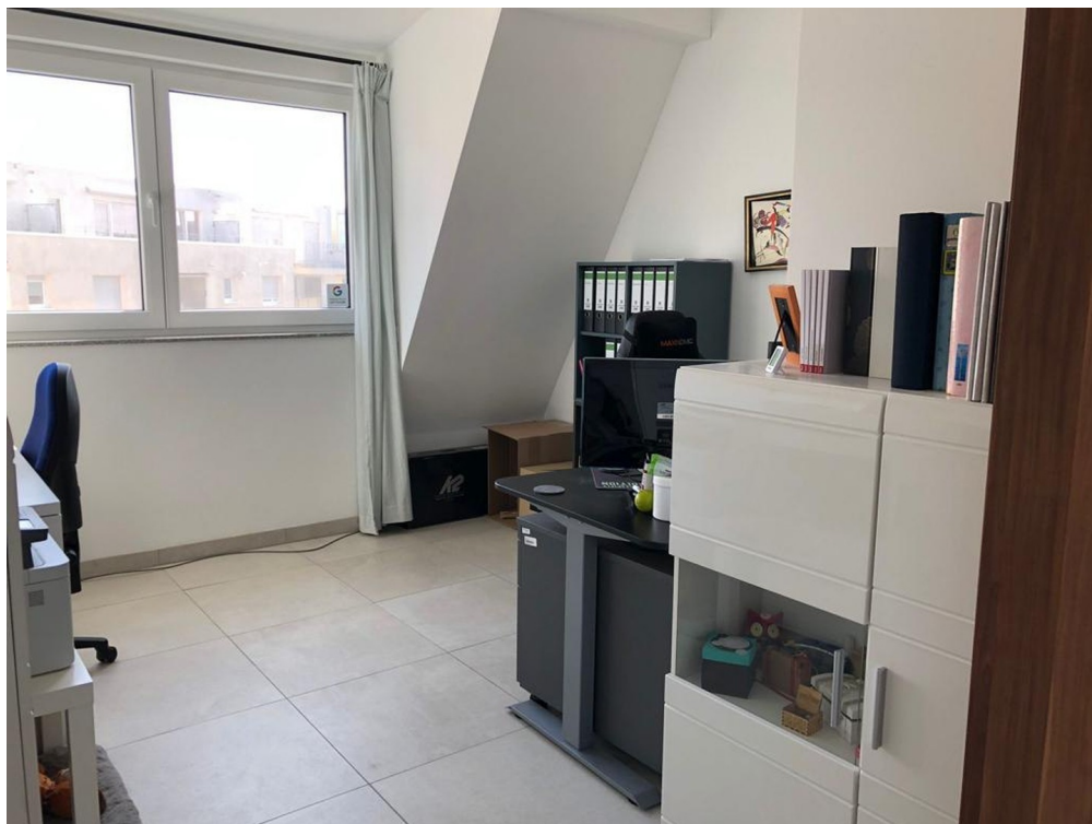
Kinderzimmer/ Büro 1