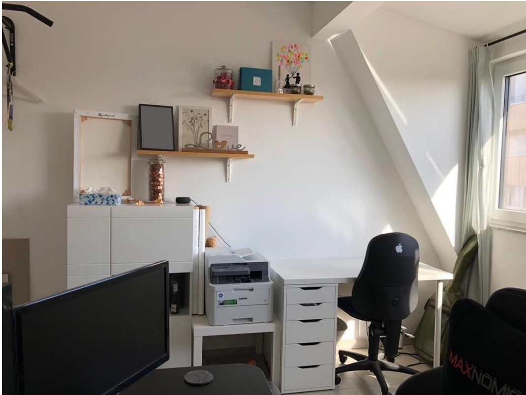
Kinderzimmer/ Büro 1