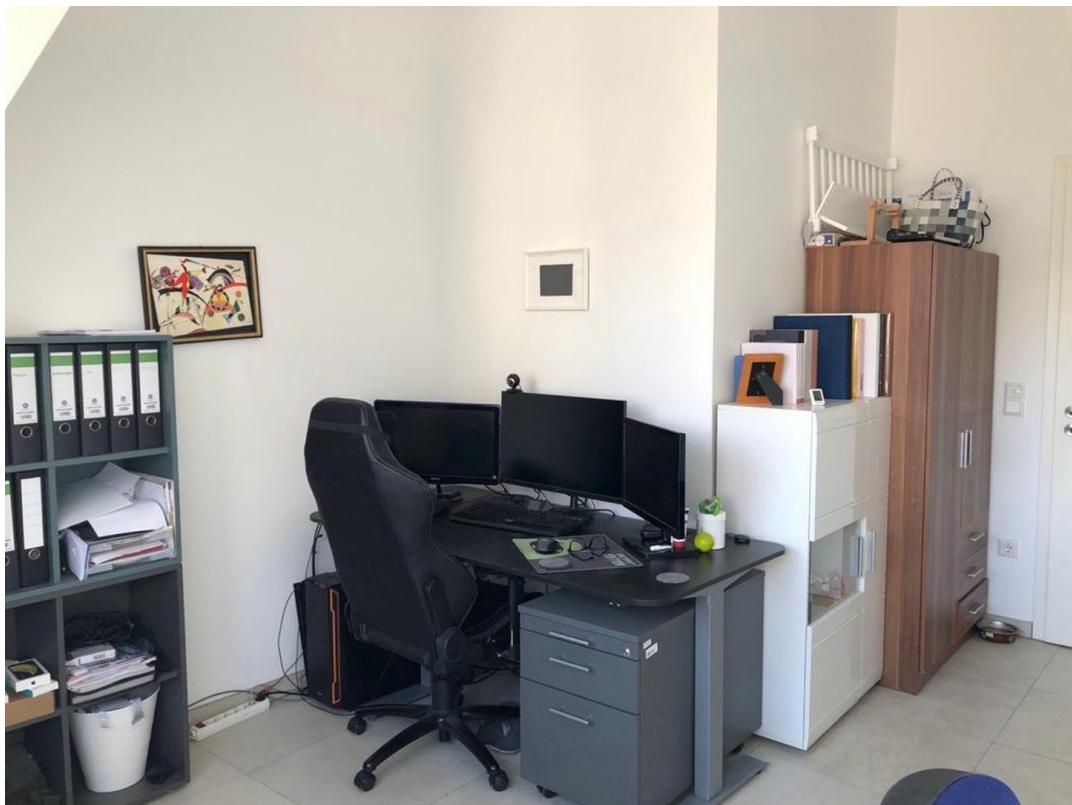
Kinderzimmer/ Büro 1