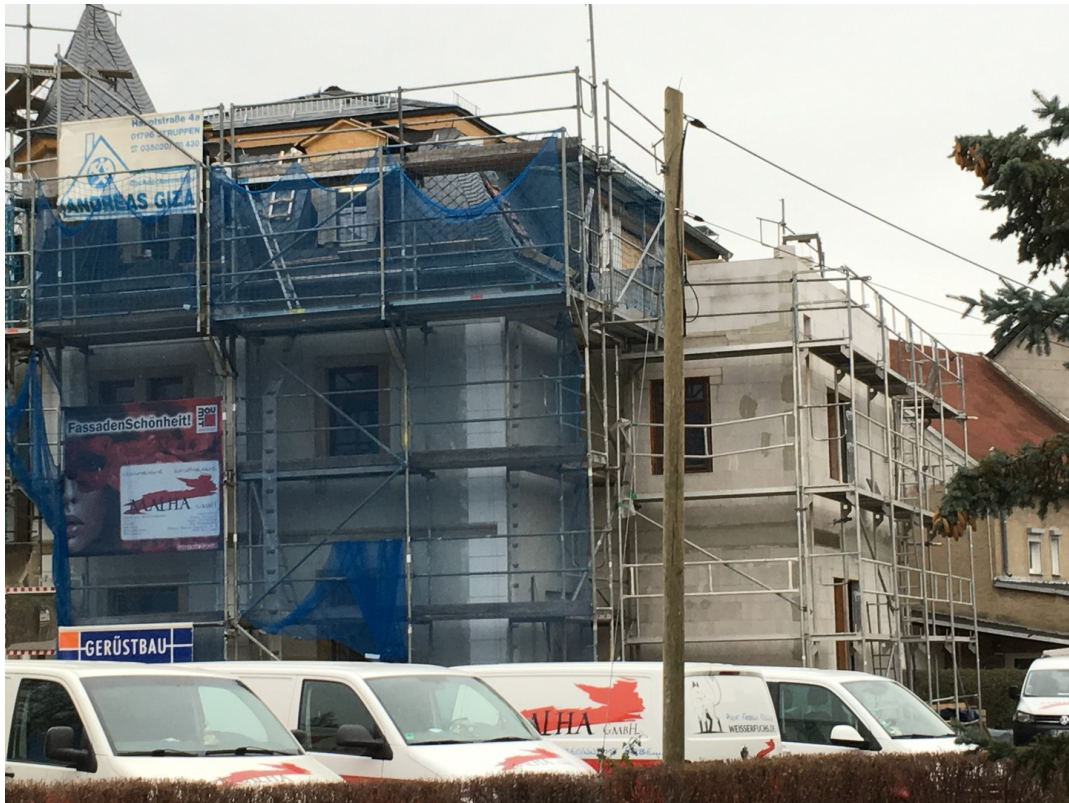
Außenansicht Dezember 2018