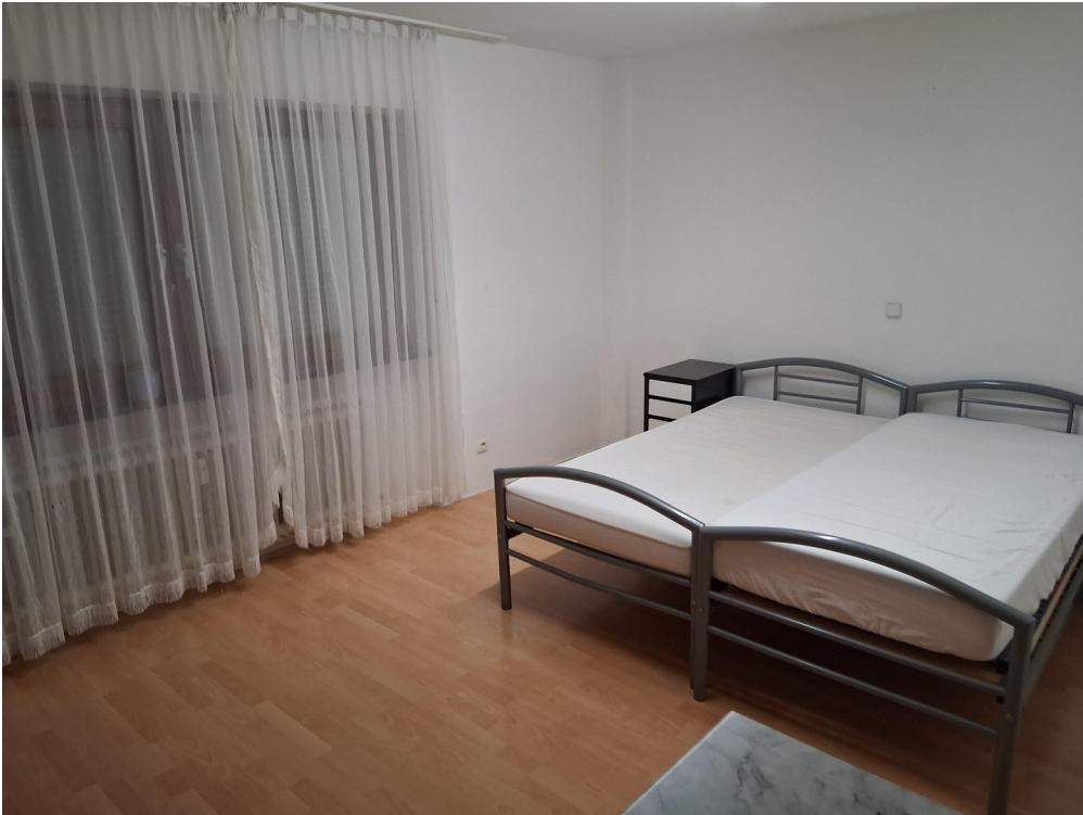
Zimmer rechte Seite