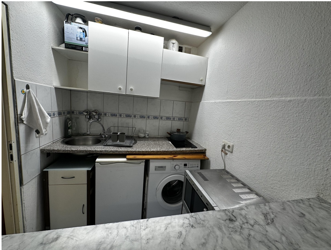
Blick in Küche