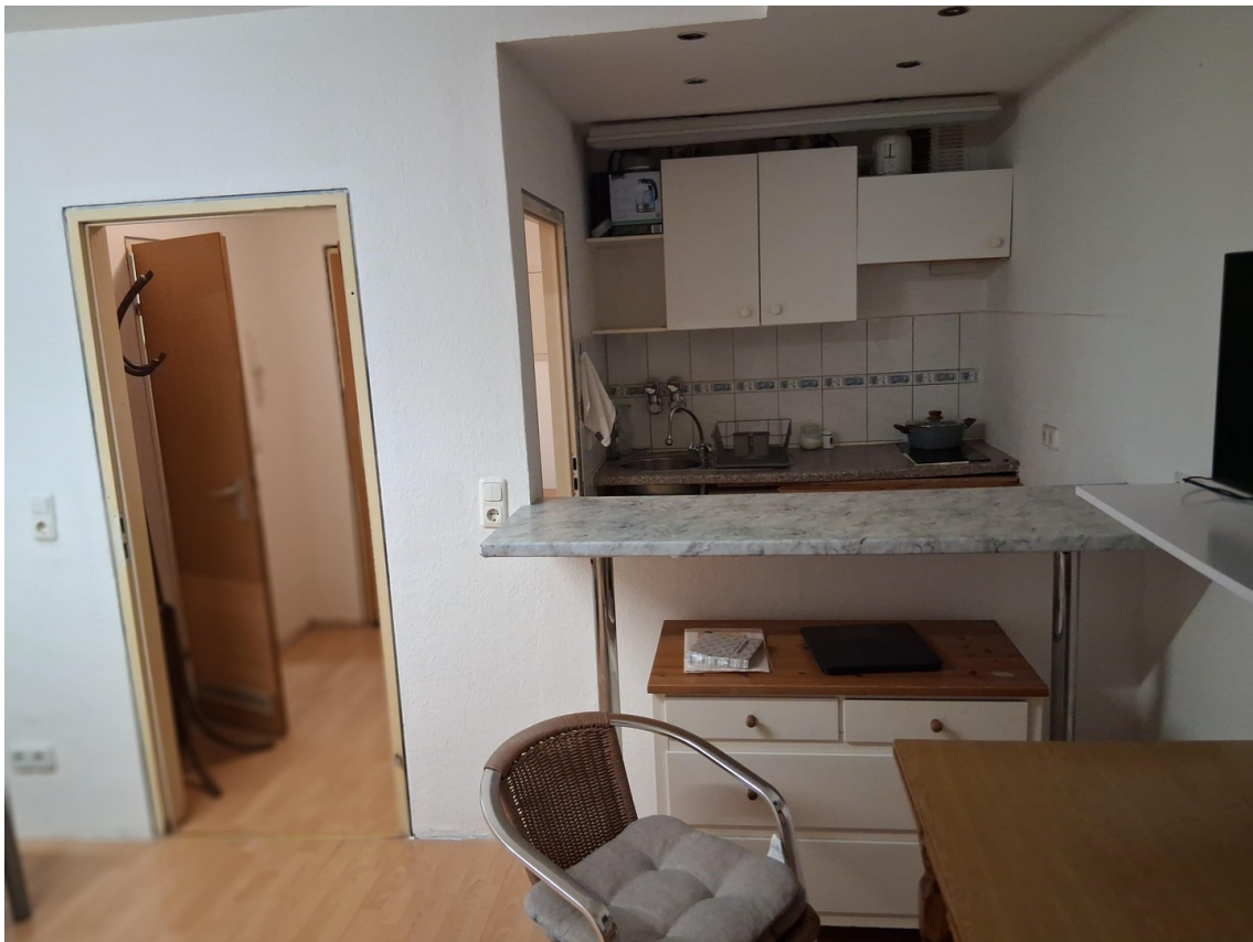
Zimmer, Flur, Küche