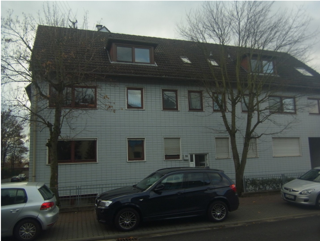
Straßenseite des Hauses