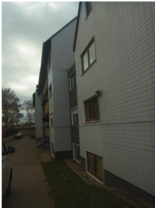
Ostansicht des Hauses