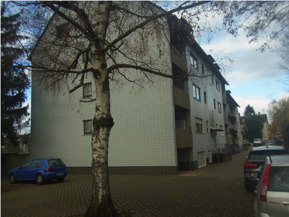
Südansicht des Hauses