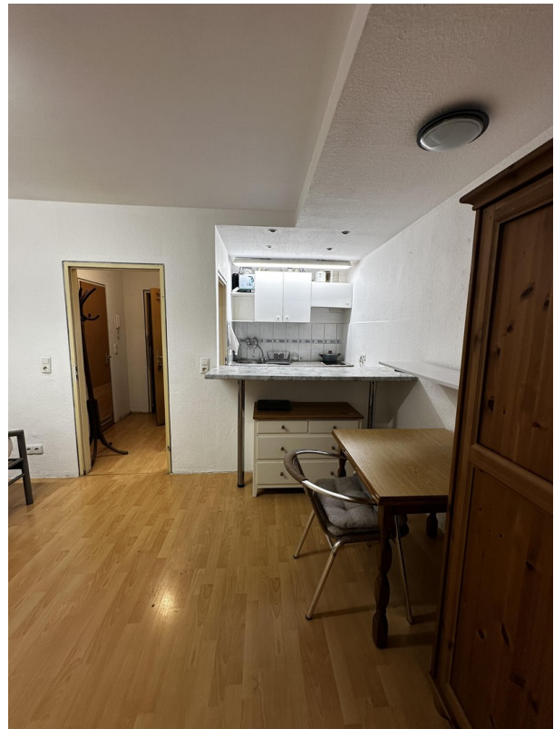
Zimmer u Eingang