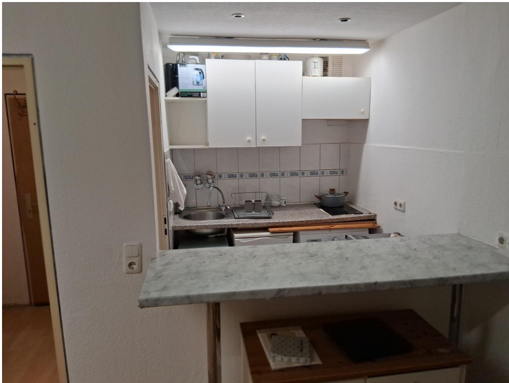
Blick in Küche