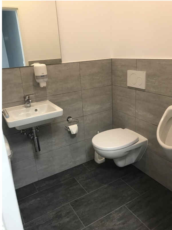
Herren Gäste WC