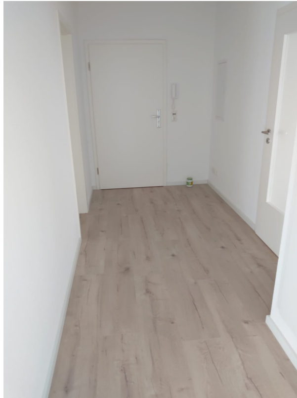
Flur mit FBH