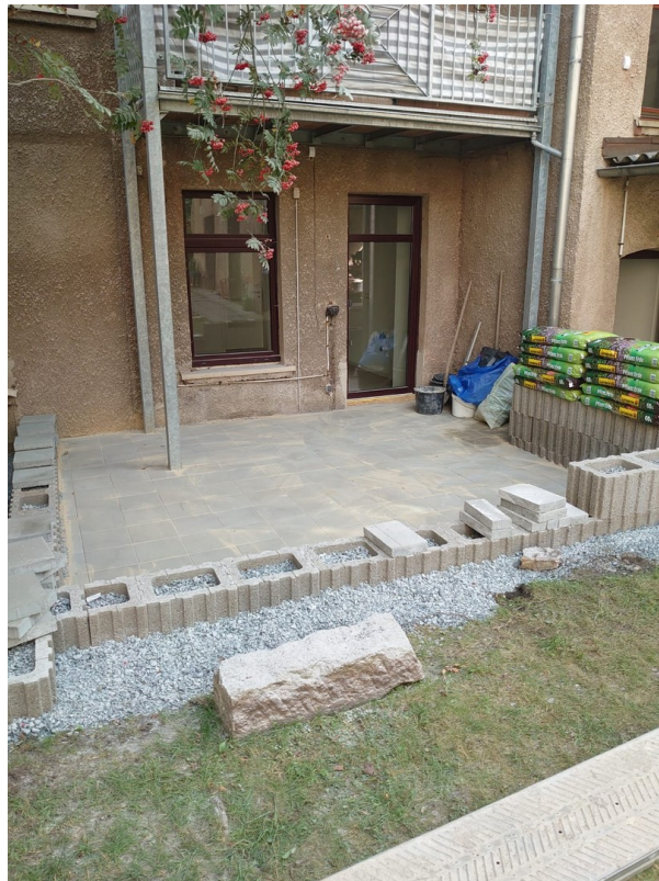
Große Terrasse / Garten