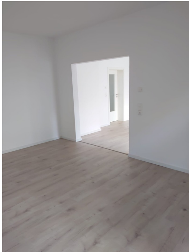
Wohnzimmer Blick zur Küche mit