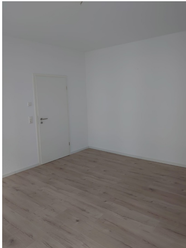
Schlafzimmer mit FBH