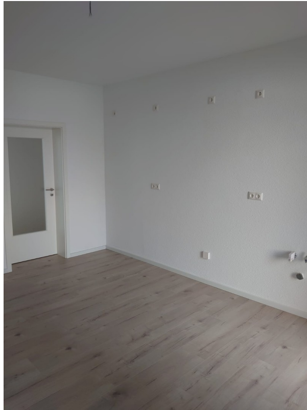
Küche - Detail mit FBH