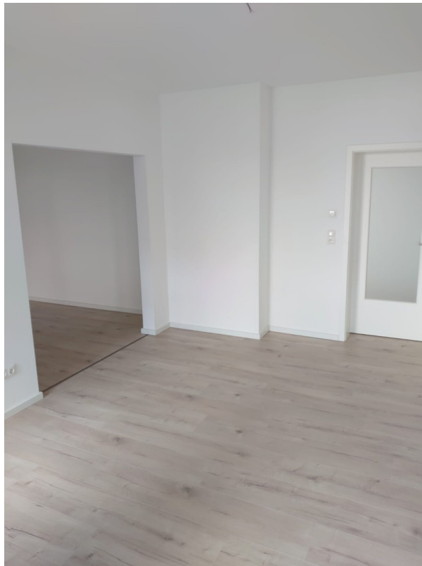
Küche zum Wohnzimmer mit FBH