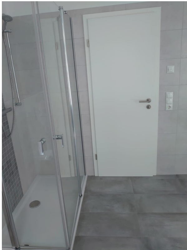
Großes Bad-Detail mit FBH