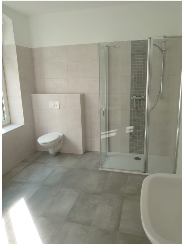
Großes Bad-Detail mit FBH