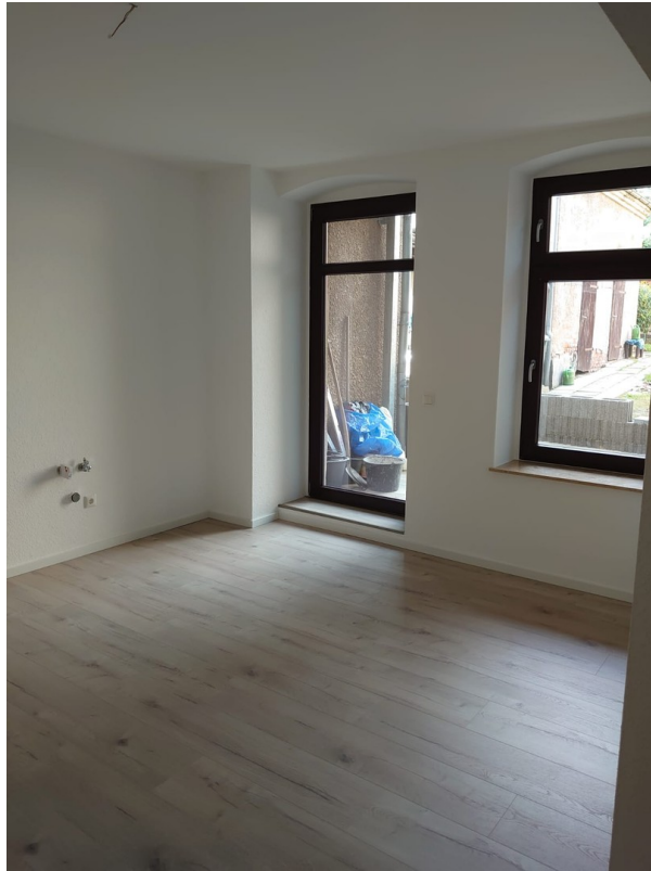
Küche mit Balkon mit FBH