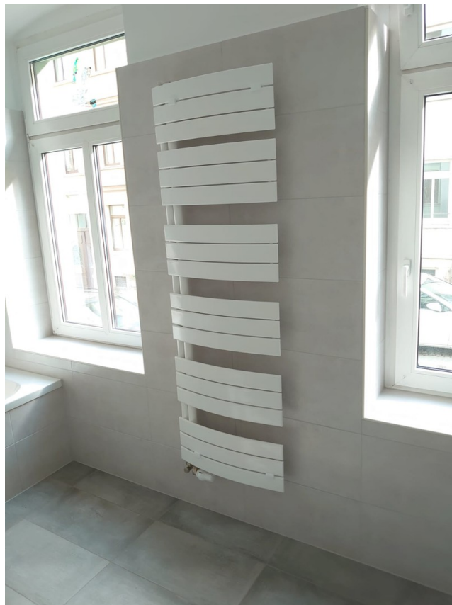
Großes Bad-Detail mit FBH