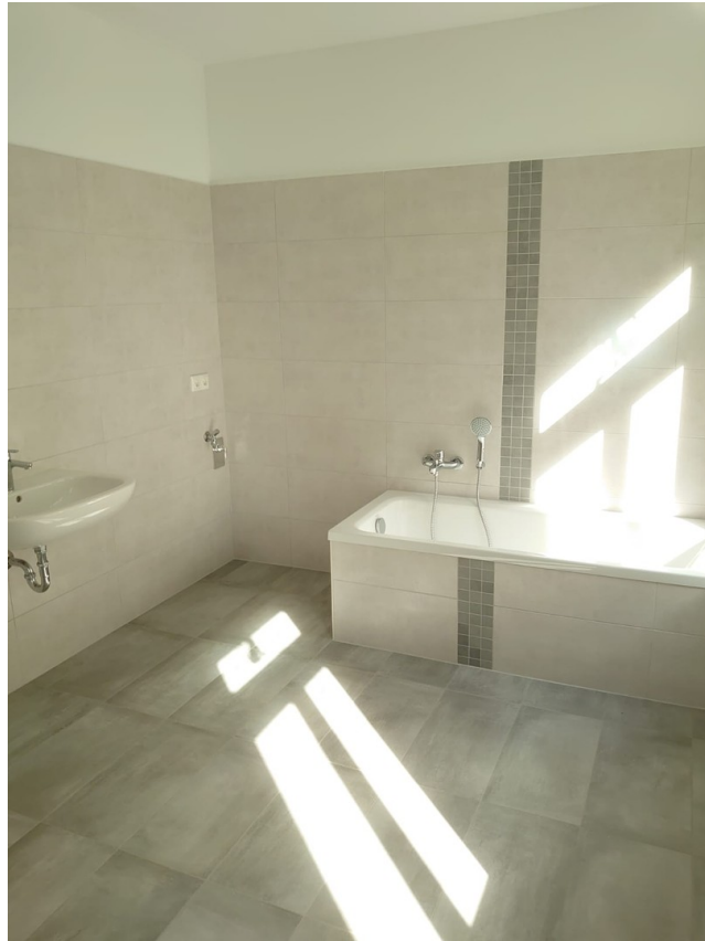
Großes Bad-Detail mit FBH