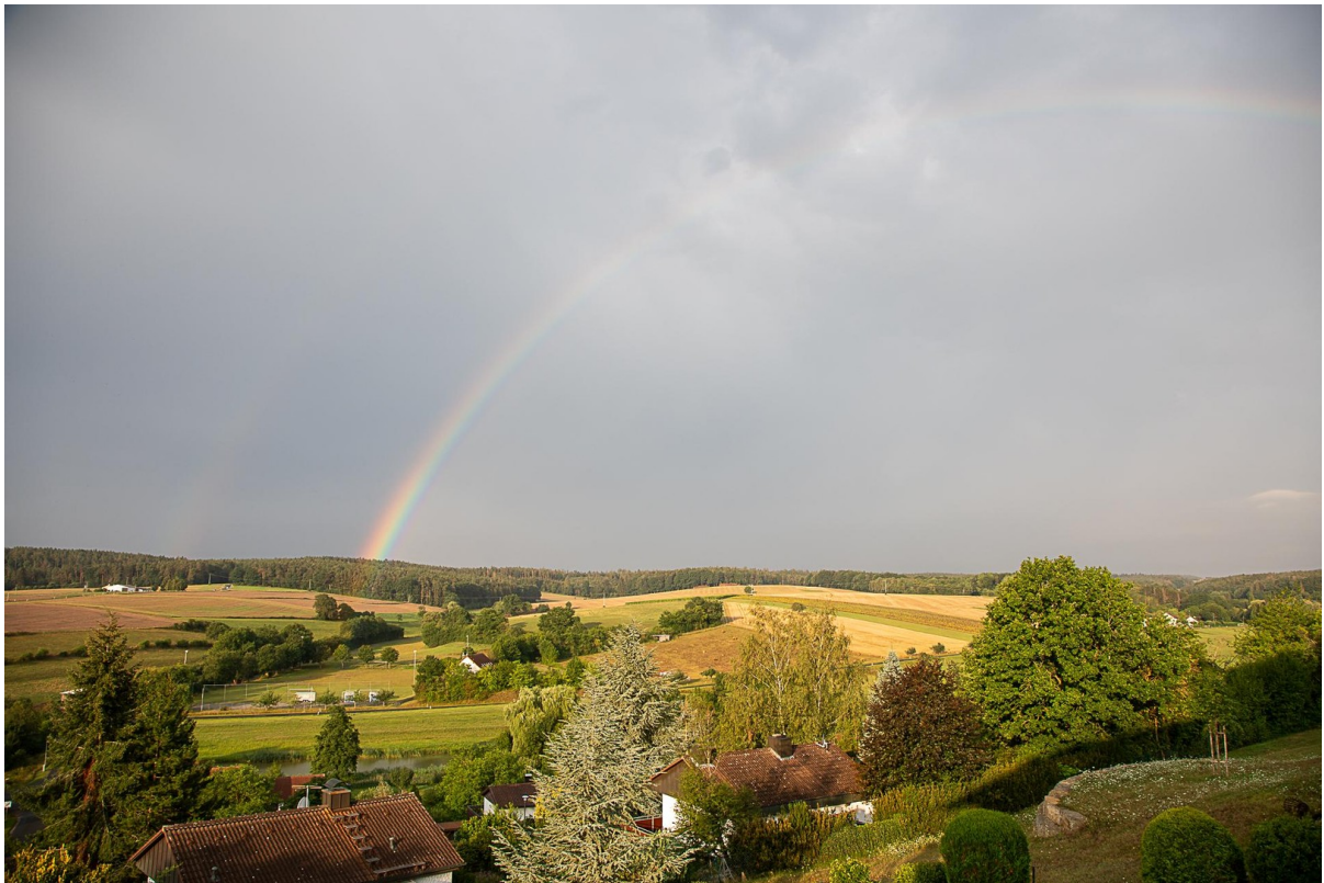
Blick nach Süden