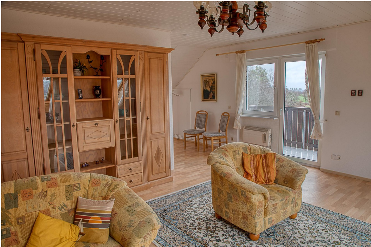
DG - Wohnzimmer