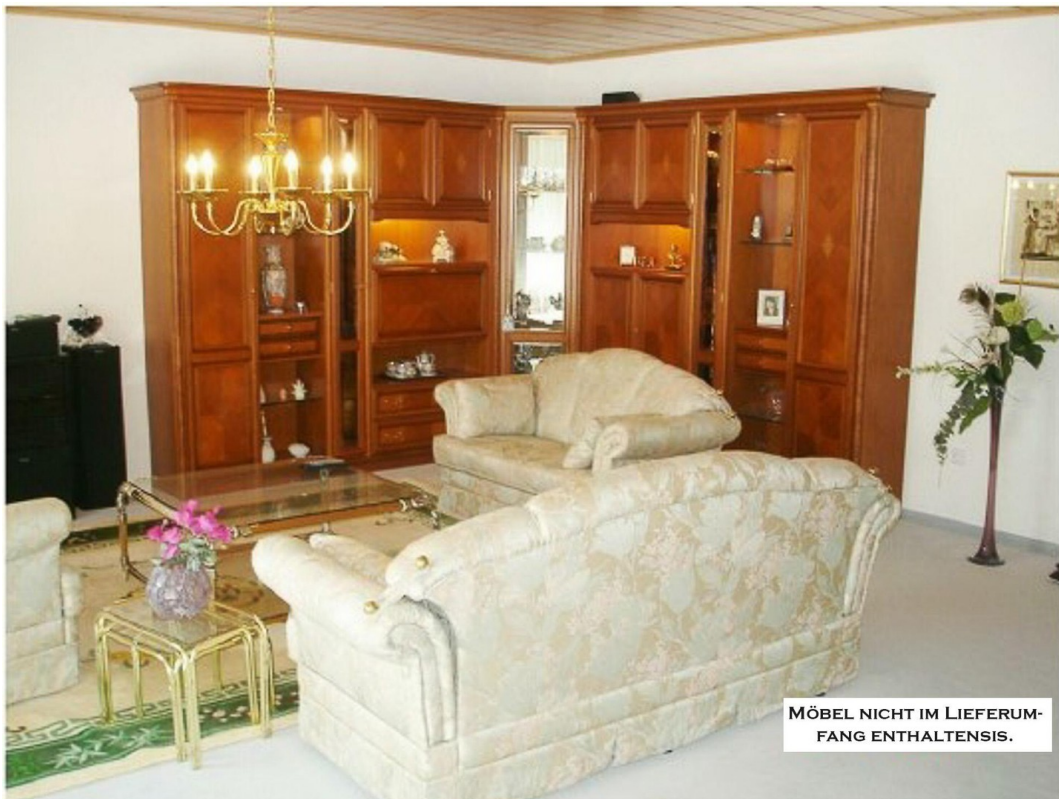
EG - Wohnzimmer