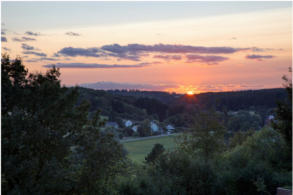
Blick nach Westen