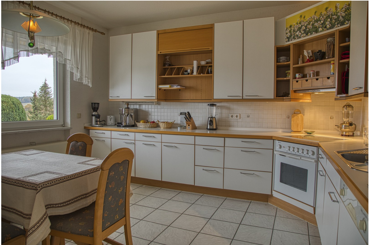
UG - Küche