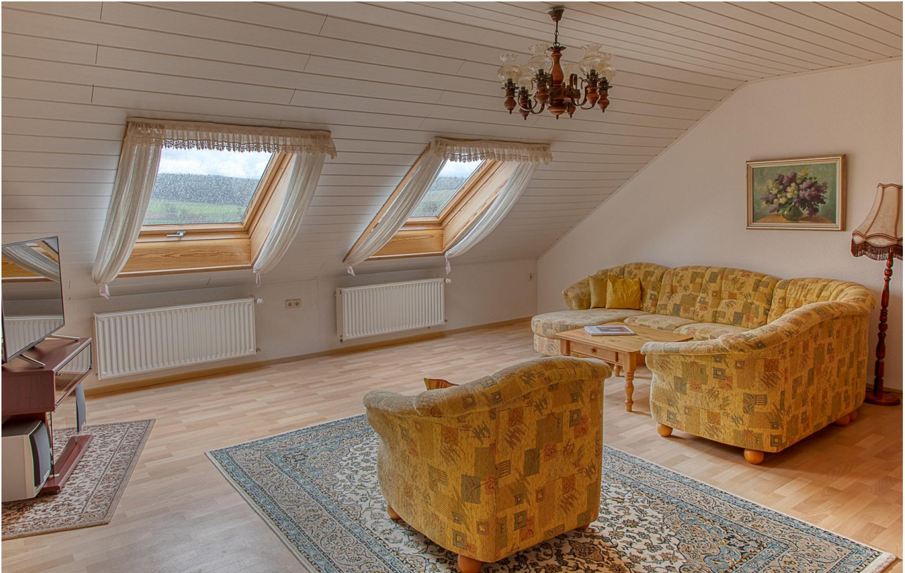
DG - Wohnzimmer