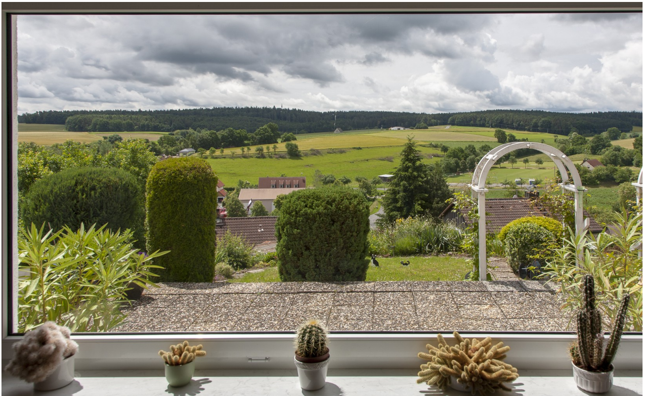
UG - Esszimmer Blick