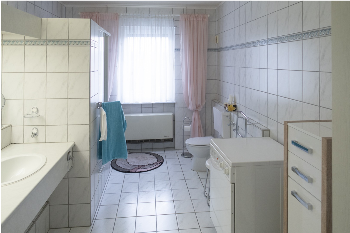
UG - Dusche-WC