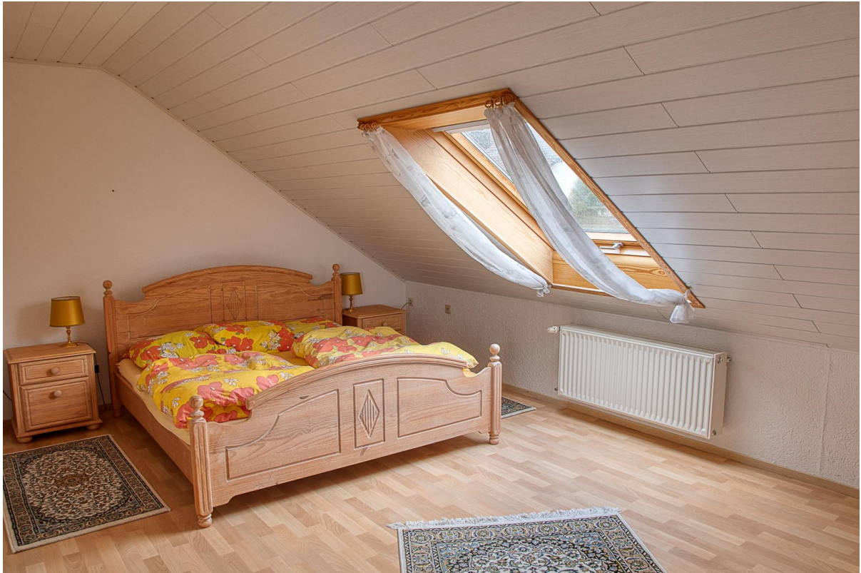
DG - Schlafzimmer