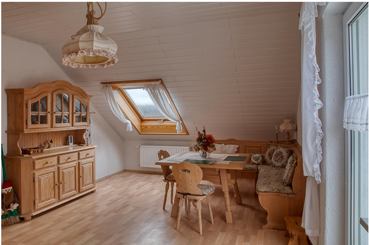
DG - Küche-Essbereich