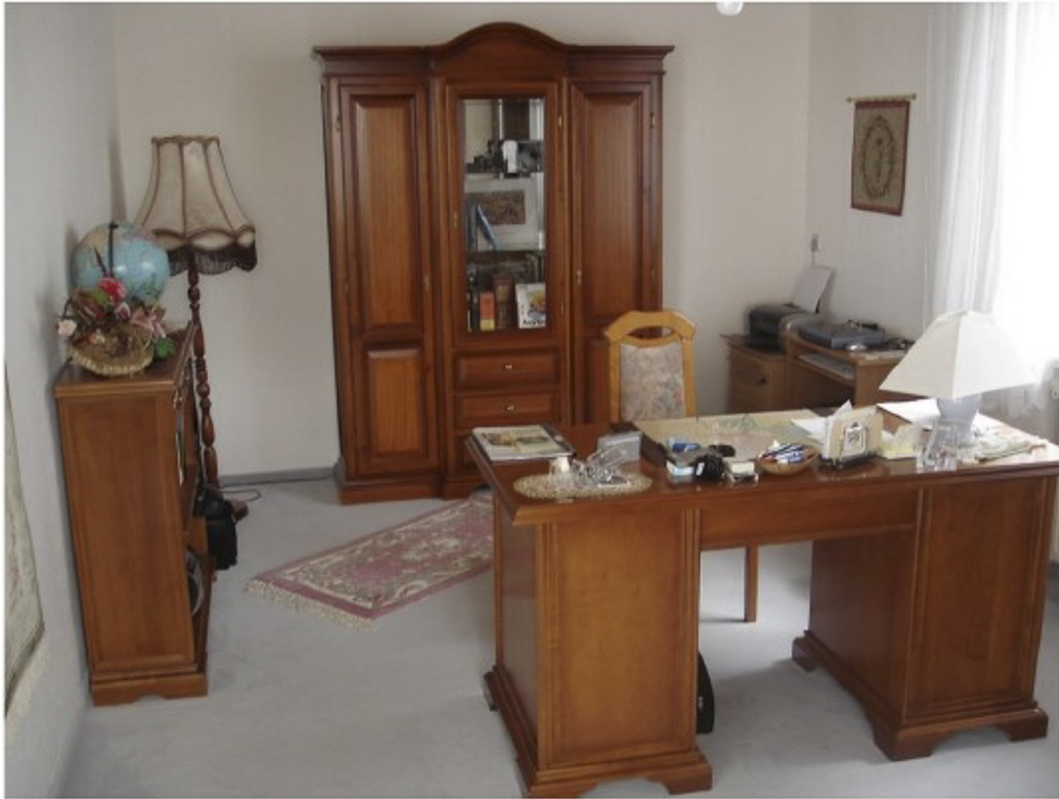
EG - Arbeitszimmer