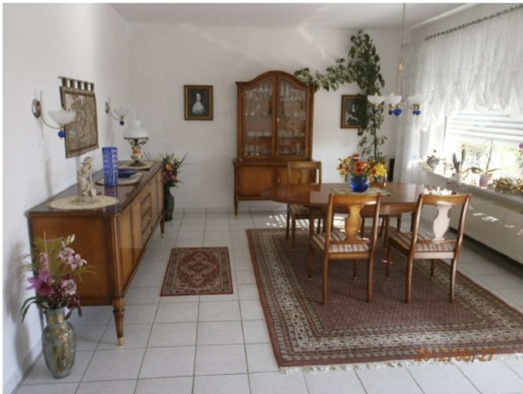
UG - Esszimmer