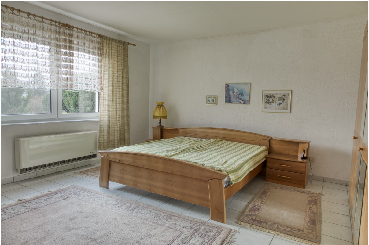
UG - Schlafzimmer