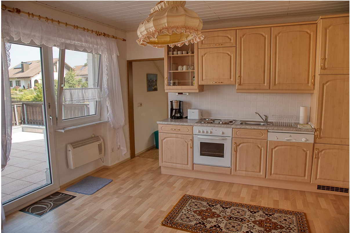
DG - Küche