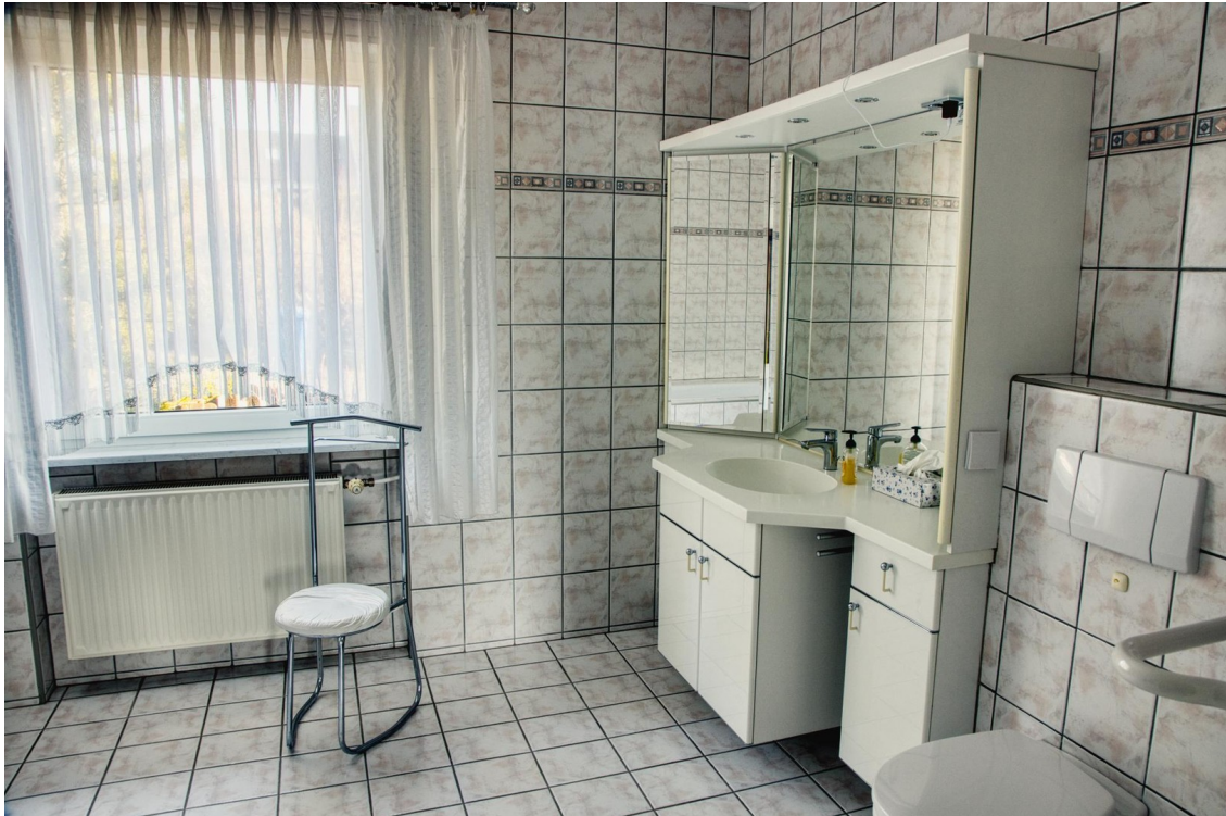
EG - Bad-WC