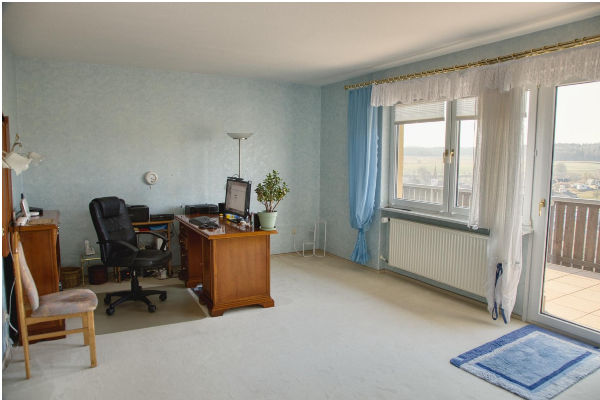
EG - Schlafzimmer