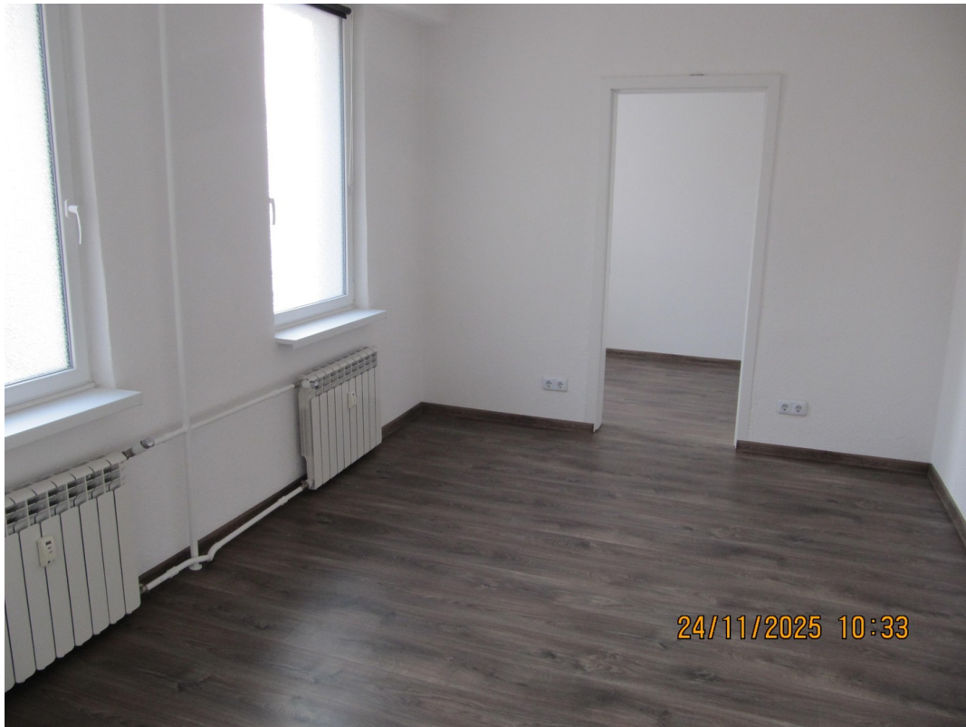
Schlafzimmer mit Ankleide