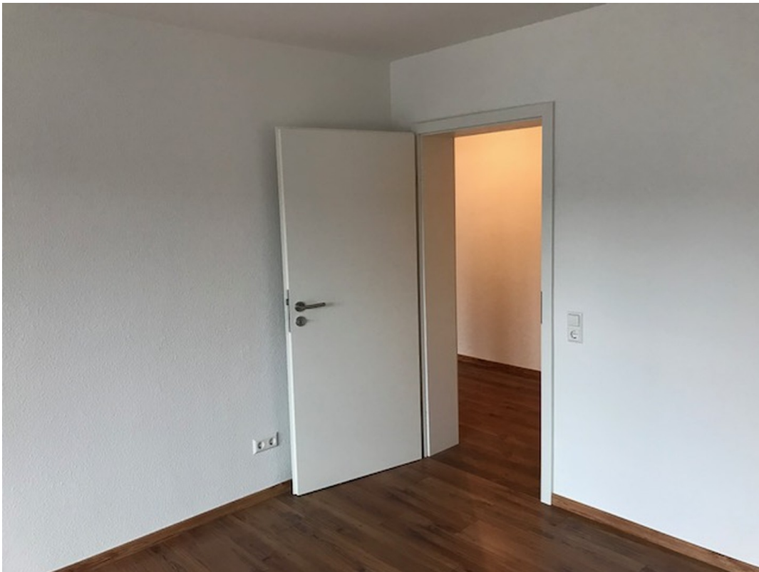
Eingang ins Zimmer