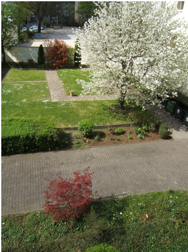
Blick in begrünten Innenhof