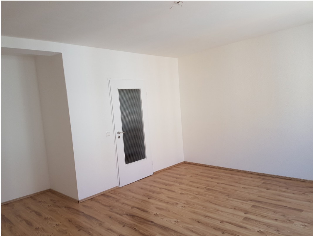
Wohnzimmer gegenüber Fenster