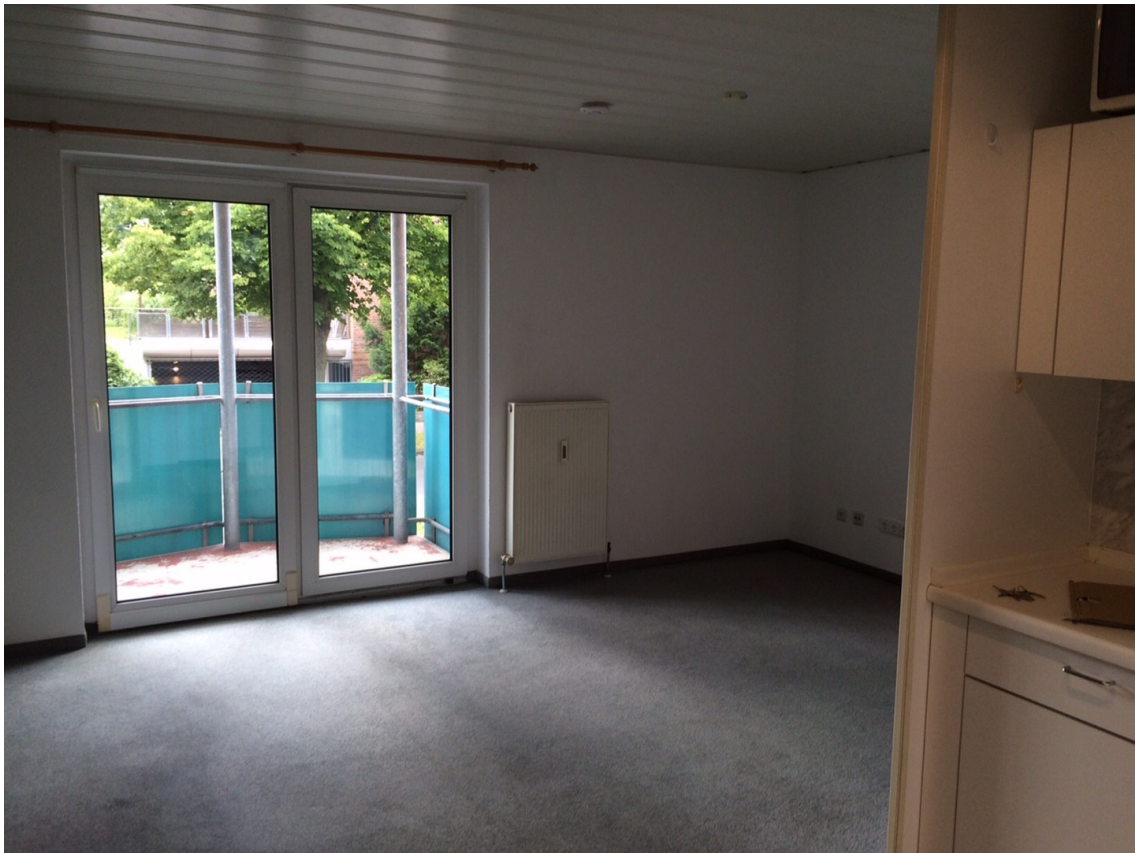
Wohn- und Schlafbereich