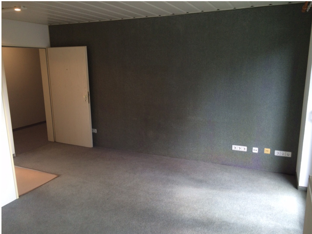
Wohn- und Schlafbereich