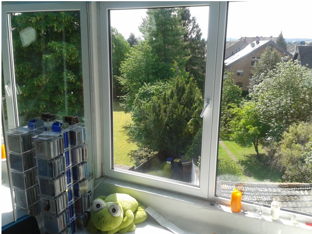
Aussicht auf Euskirchen