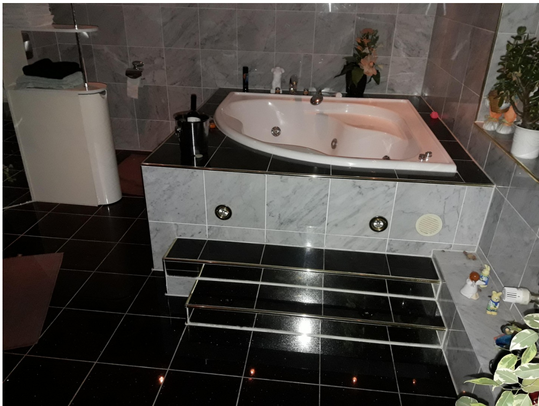
Luxus Whirlpool zum entspannen