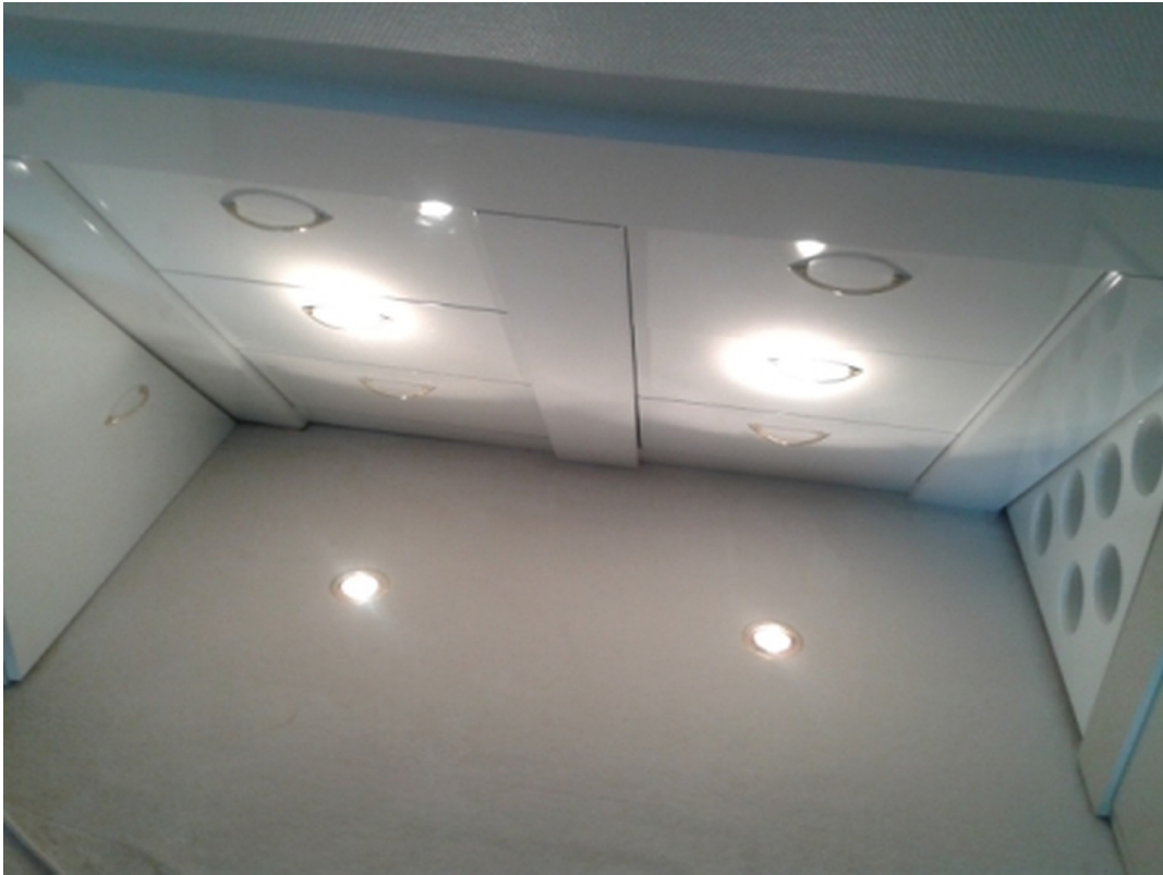
3 Etage Klimanlage