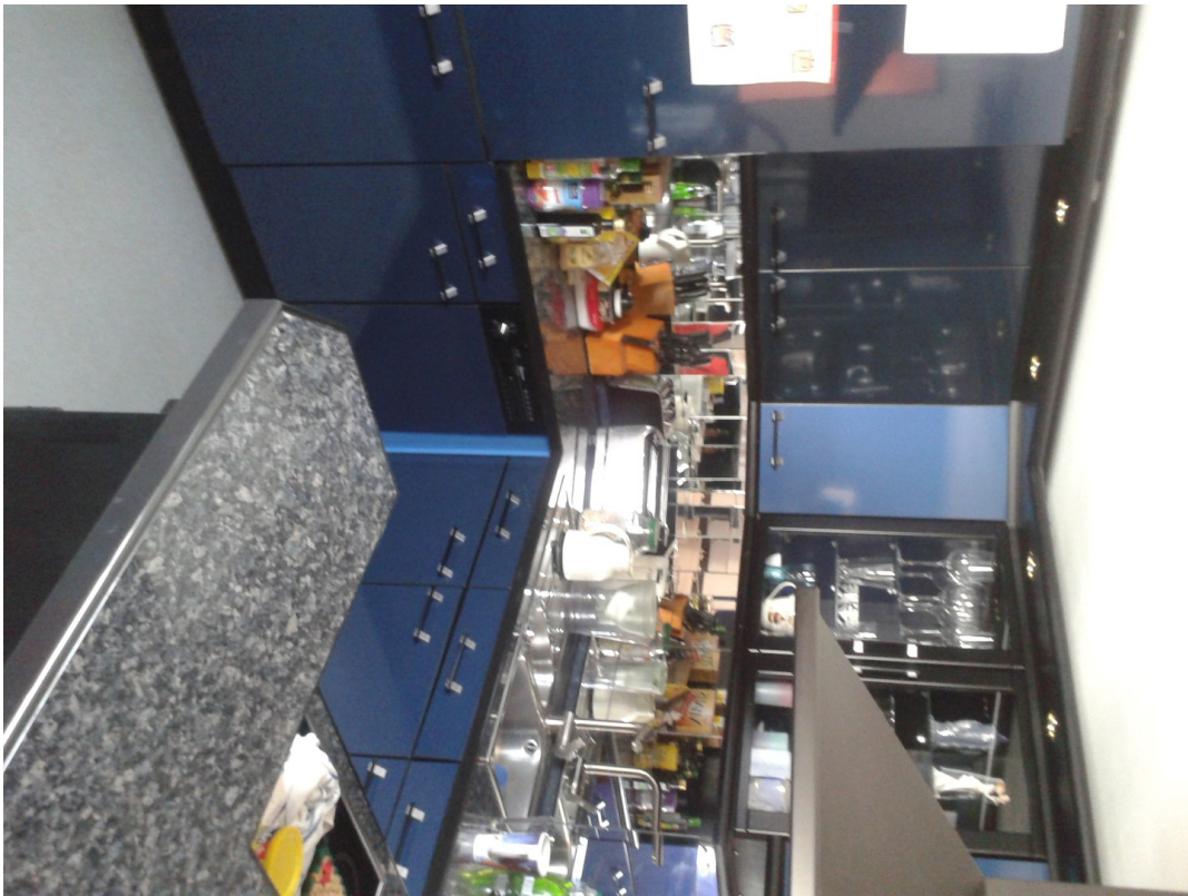
Blaue hochwertige Küche