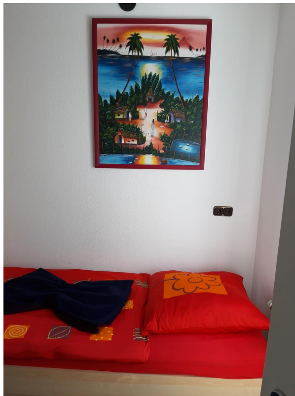
Einzelbett 1 Etage