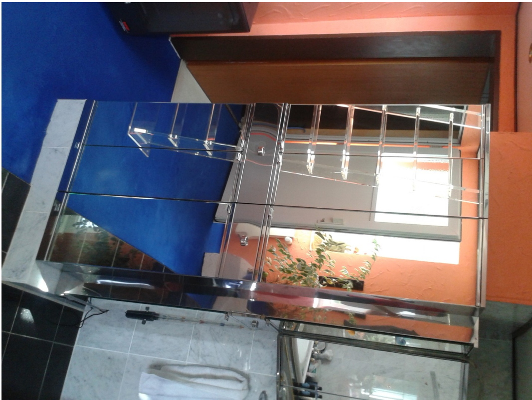
Arcyltreppe 3 Etage