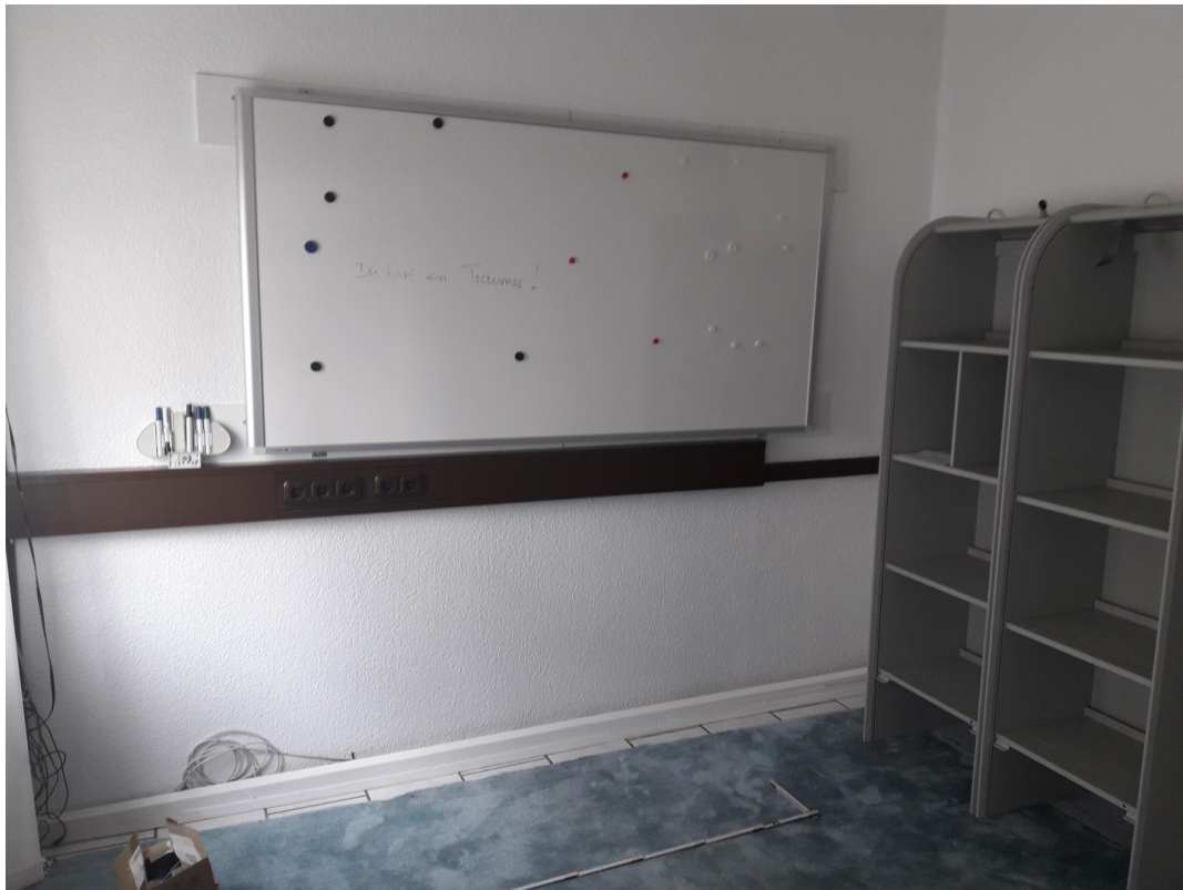
Arbeitswand Clip Chart