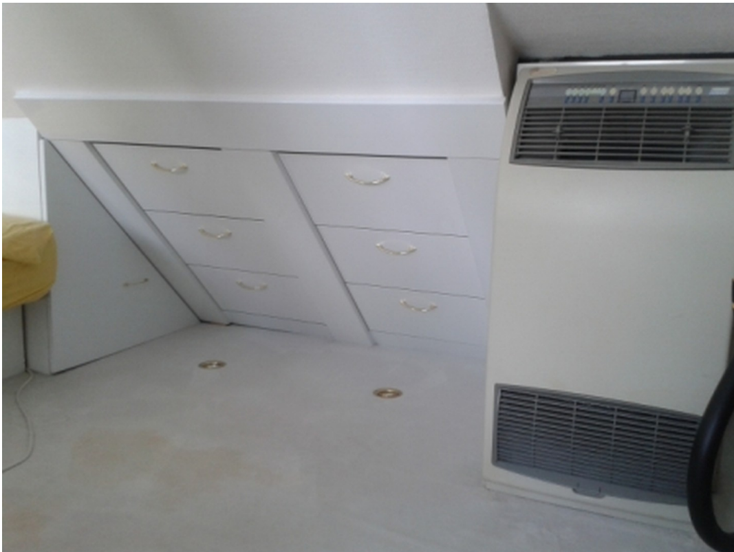
3 Etage weißer Teppichboden