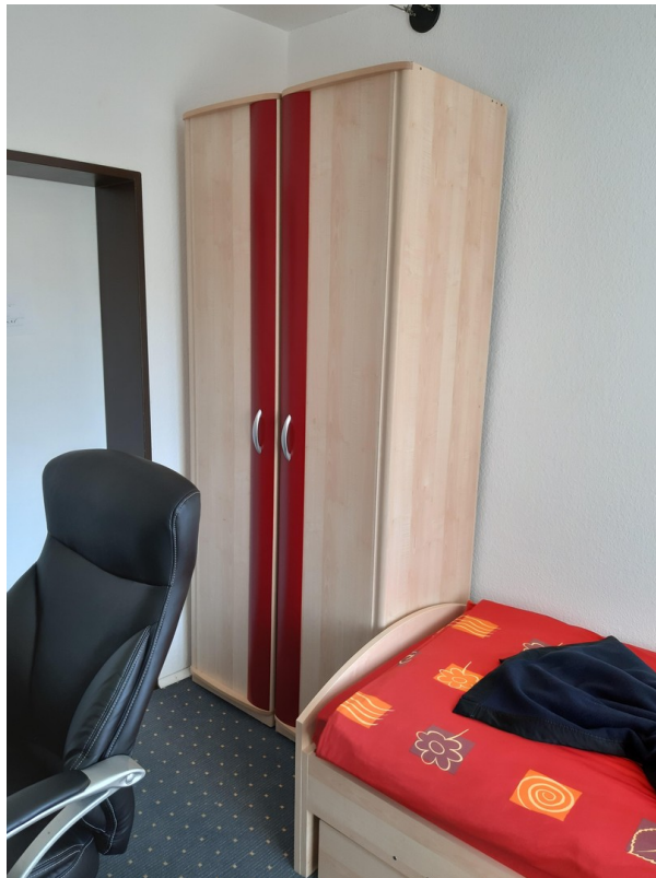
1 Etage Gästezimmer