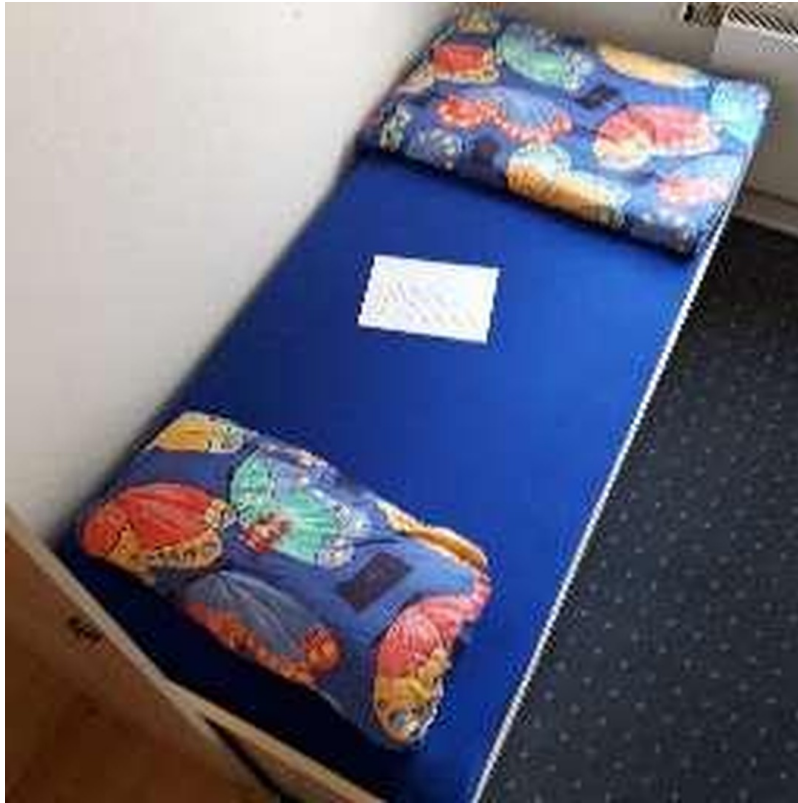
Einzelbett 1 Etage