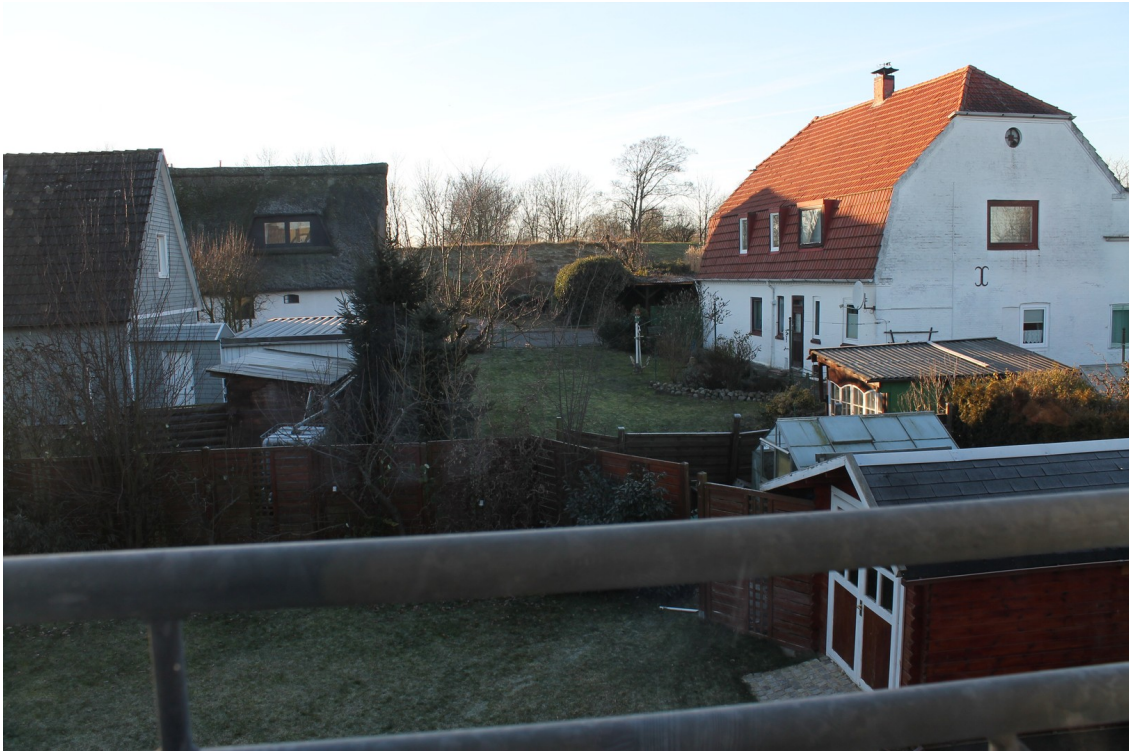
Sicht auf den Deich