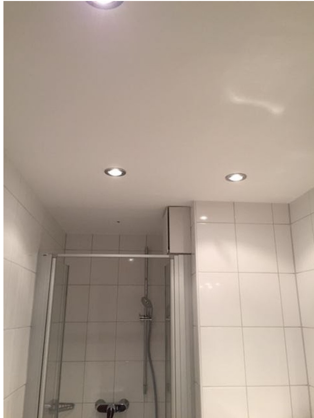
LED Decke Bad