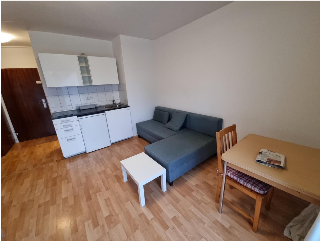
Wohnraum, EBK, Flur