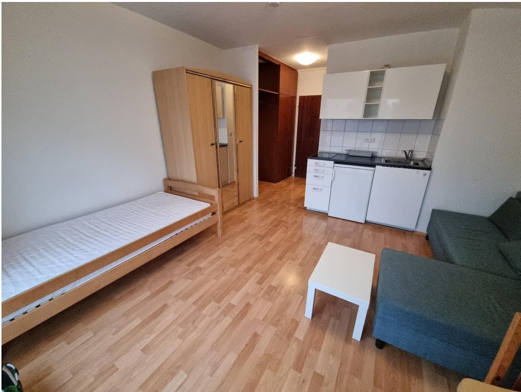
Bett, Schrank, Sofa