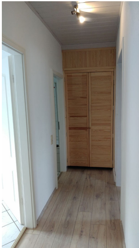
Flur zum Wohnungseingang