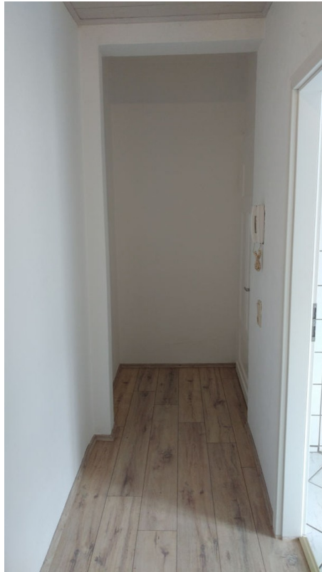
Flur zum Wohnungseingang