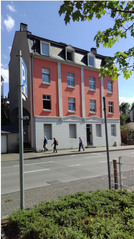
Haus von außen