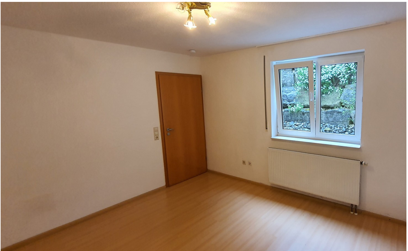
Schlafzimmer mit Gartenblick