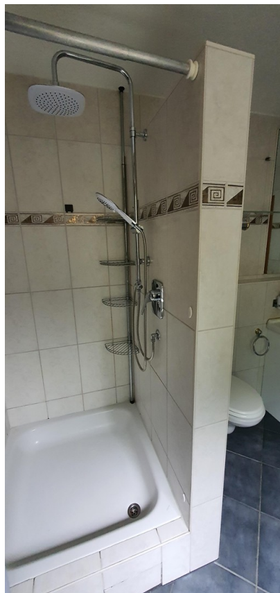
Kopfdusche & Handrause