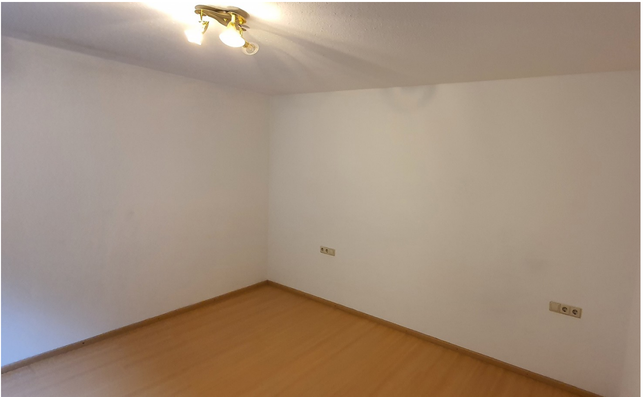
SZ mit Bettstellwand