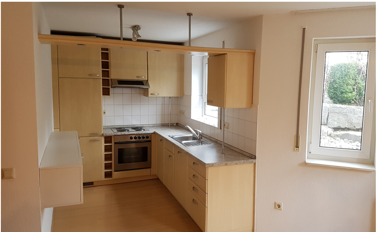
Einbauküche mit Spülmaschine