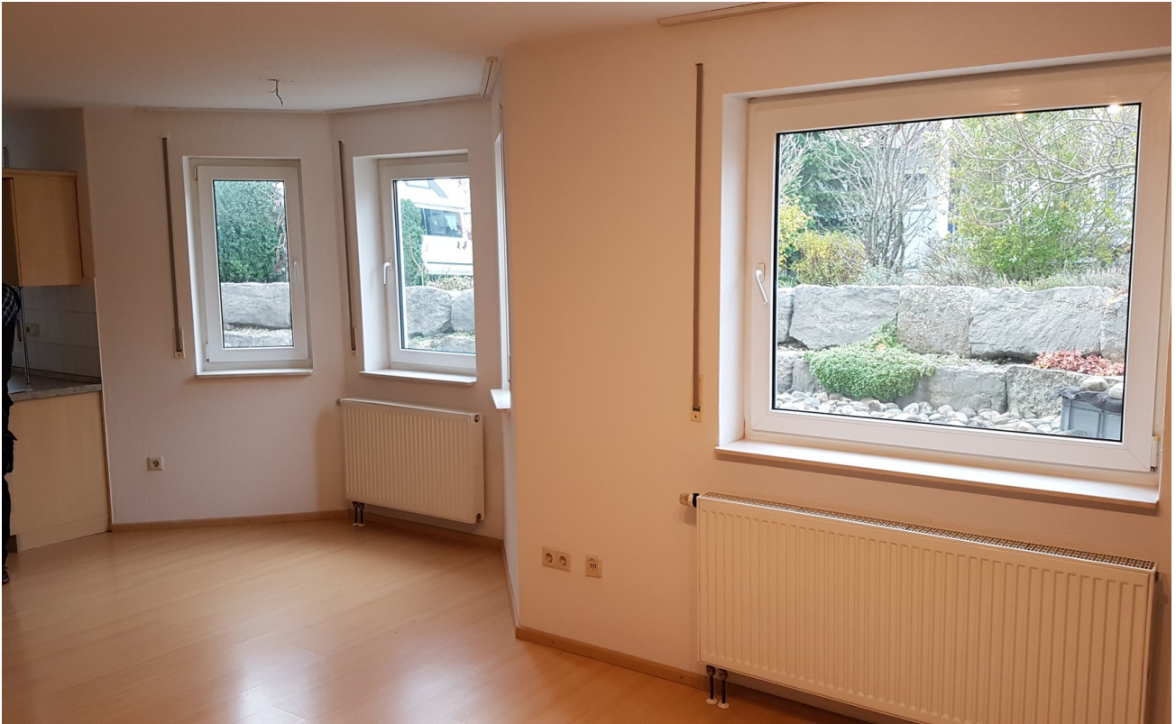
Wohn - Esszimmer zur Südseite