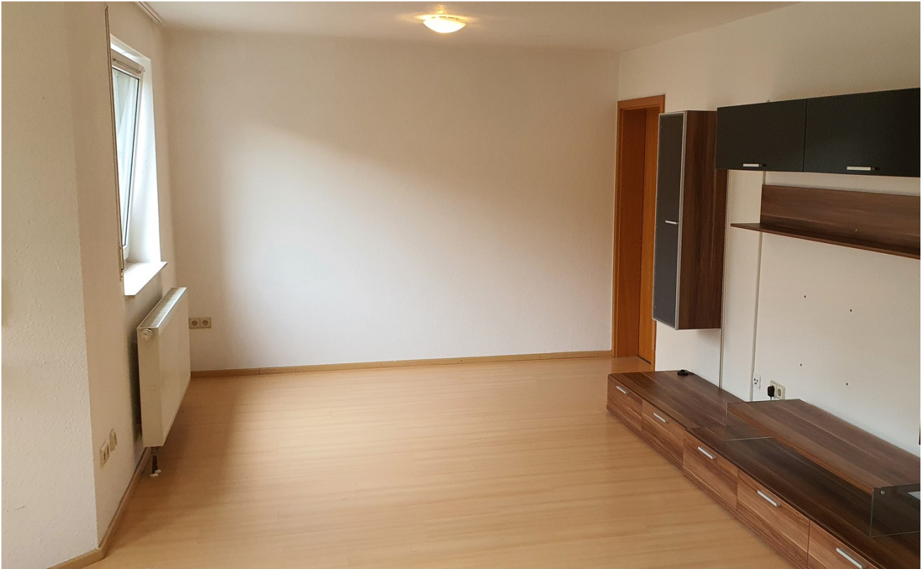
Wohnzimmer mit Schrankwand