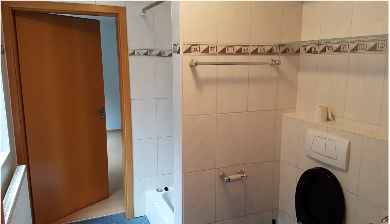
Dusche zum Schlafzimmer