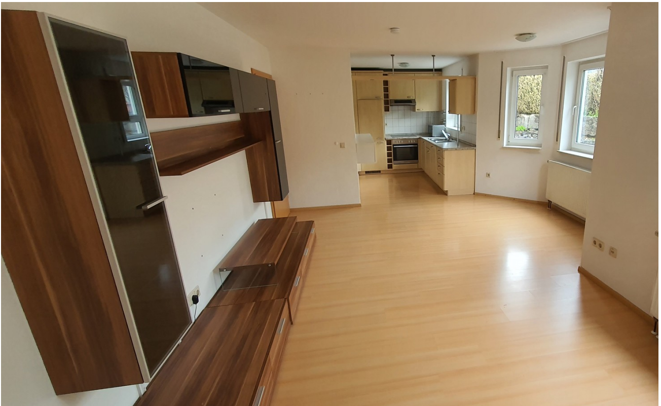
Wohnzimmer mit Schrankwand