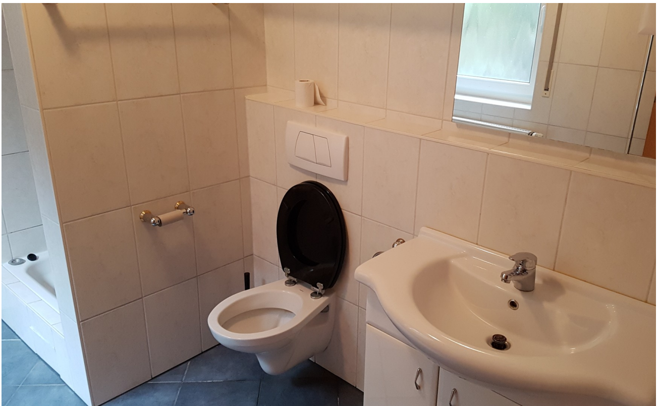
WC & Waschtisch & Unterschrank