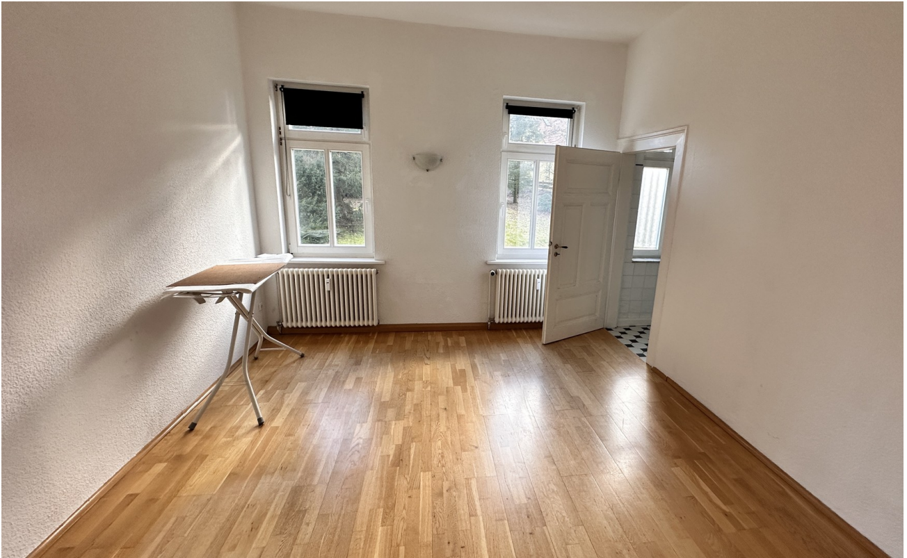
Schlafzimmer mit Tür zum Bad