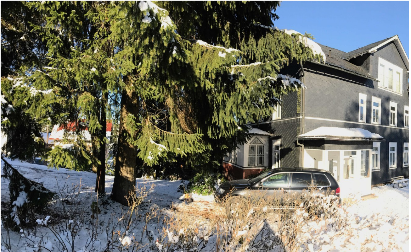
Winter Hausansicht vom Garten