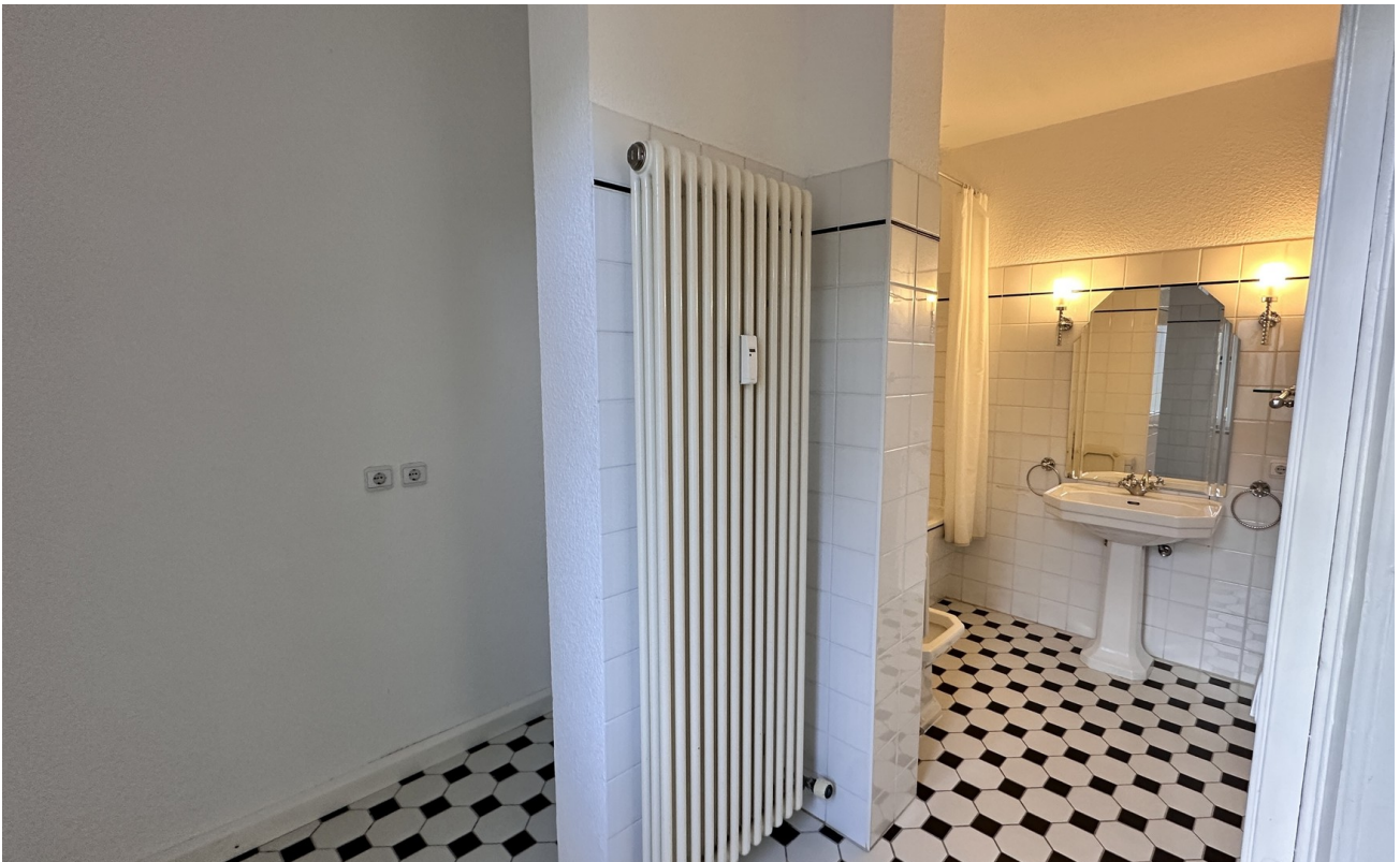
Bad + Platz für Waschm./Trockn