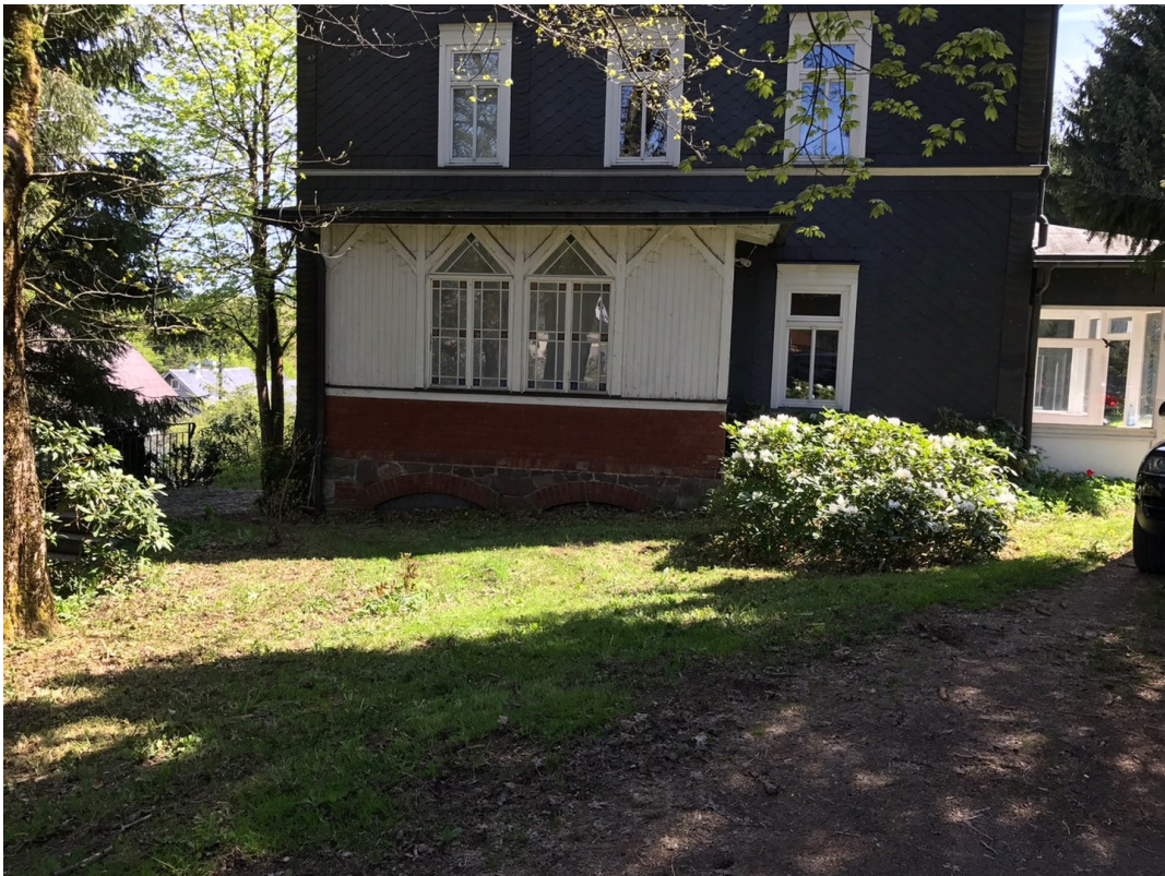
Hausansicht vom Parkplatz