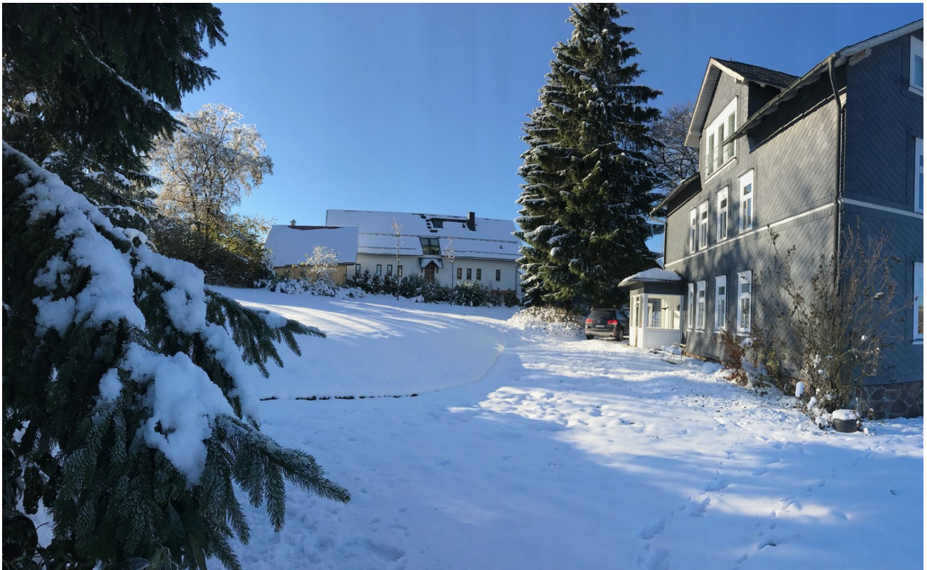
Winter Hausansicht Seite