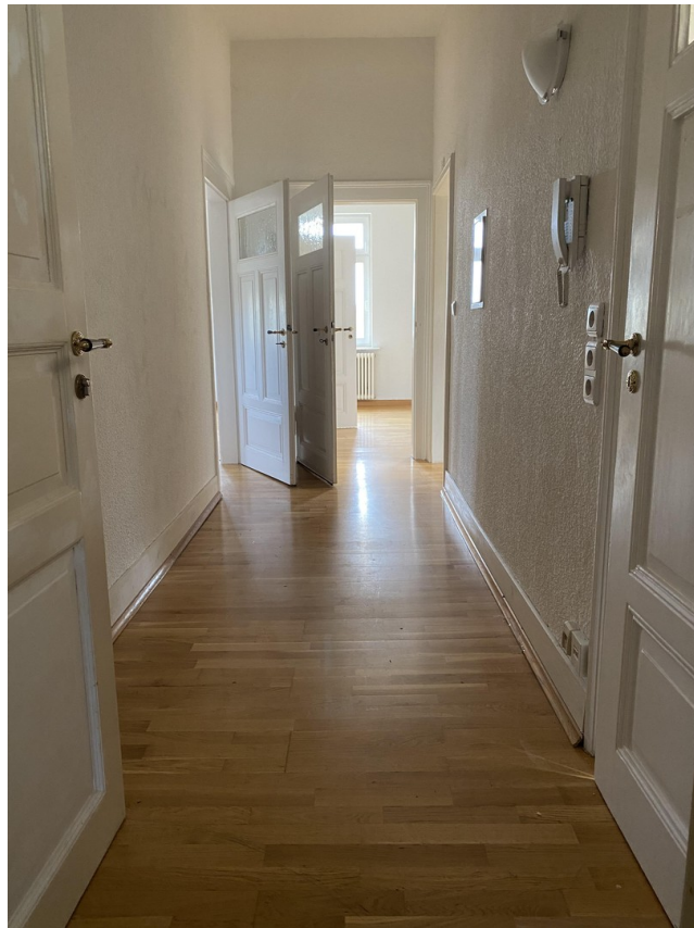
Flur / Eingangsbereich 3ZW