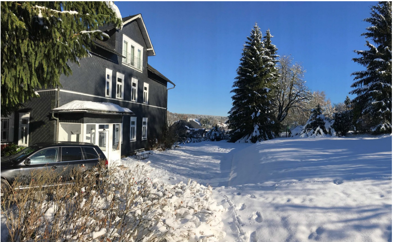
Winter Hausansicht vom Garten 2