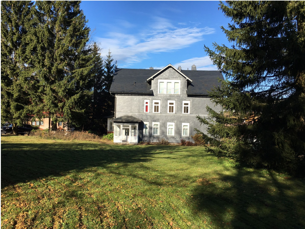
Hausansicht vom Garten