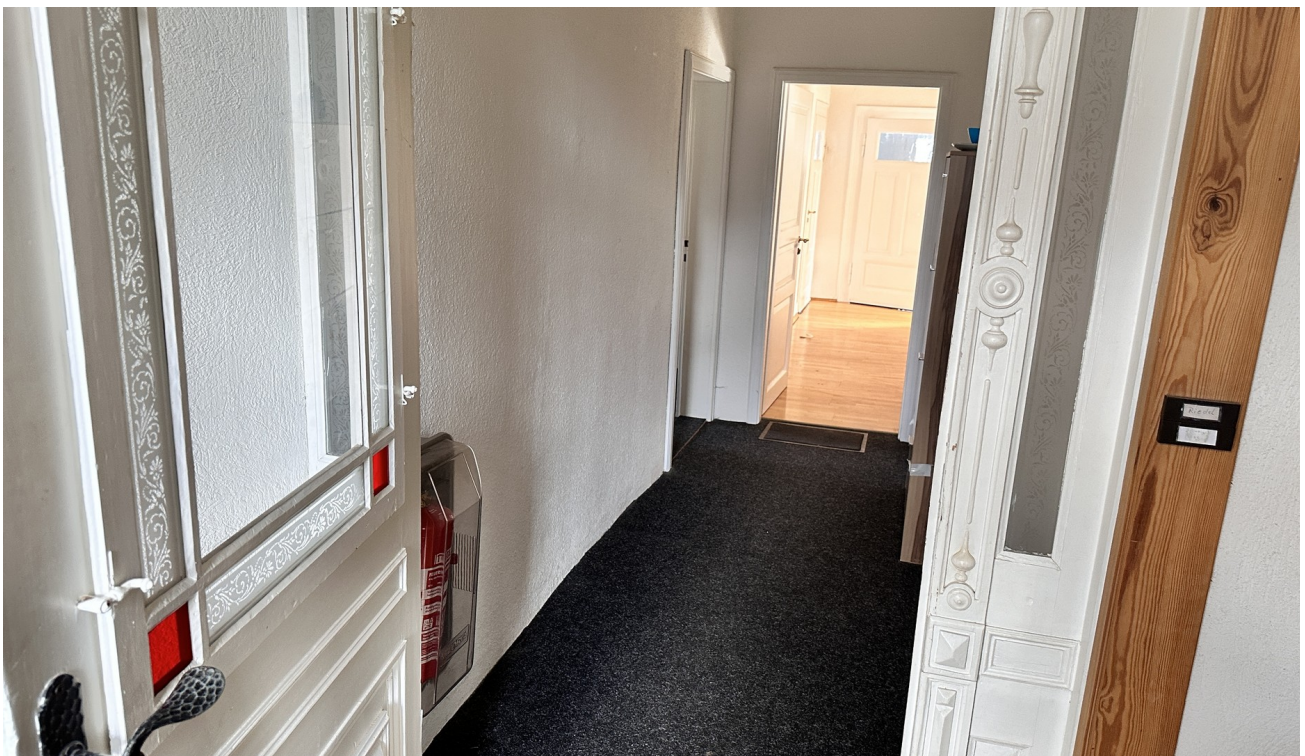
Korridor zur 1 und 3 ZW