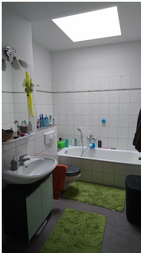
Tageslichtbad mit Wanne