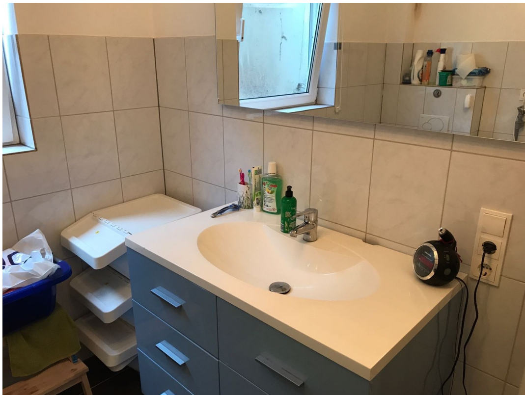
Bad Niedermenniger Str