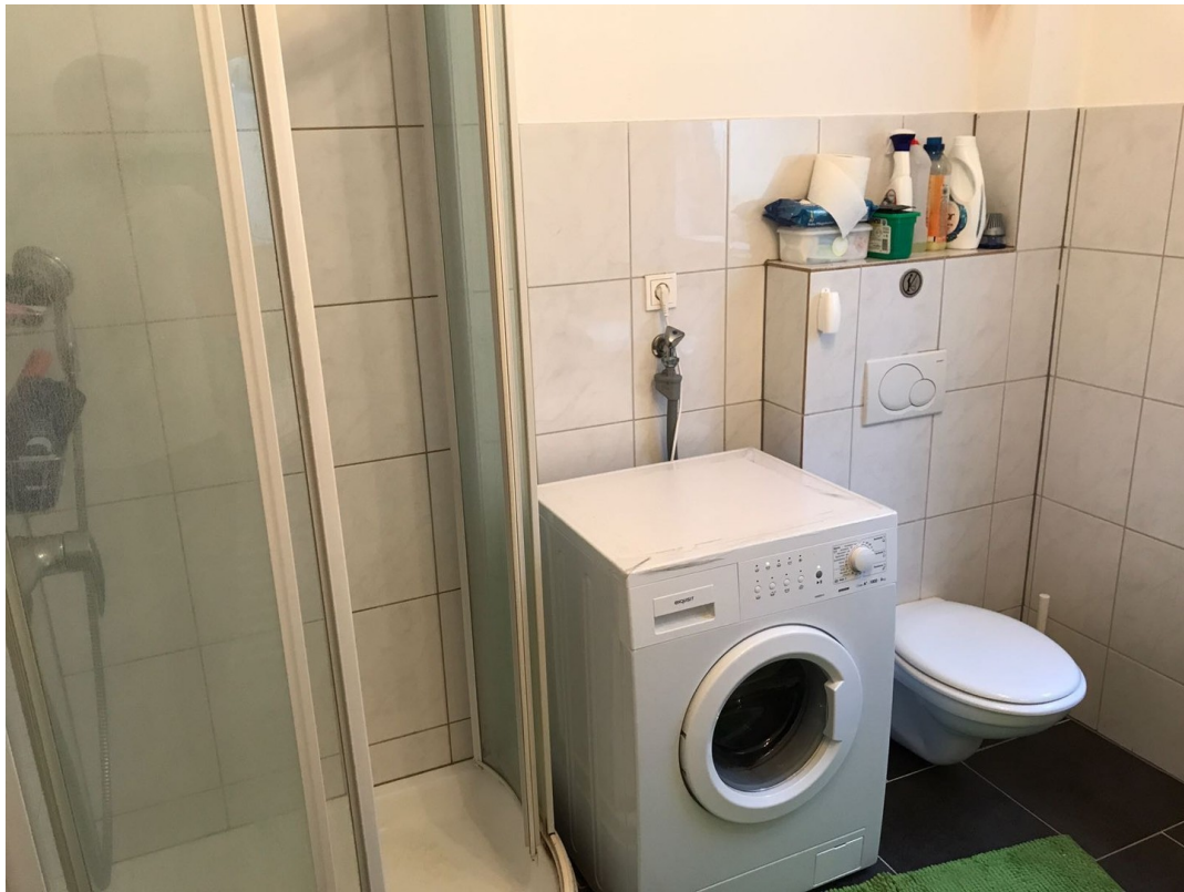
Bad Niedermenniger Str