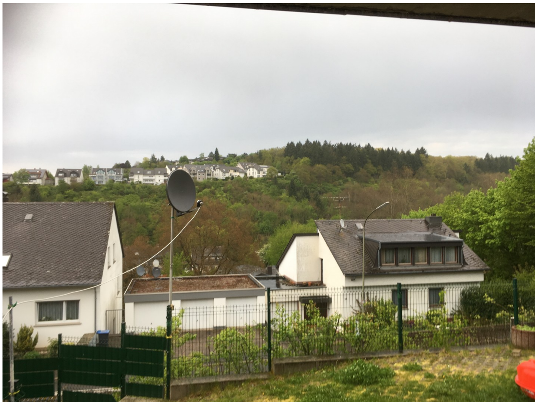
Sicht von der Terasse