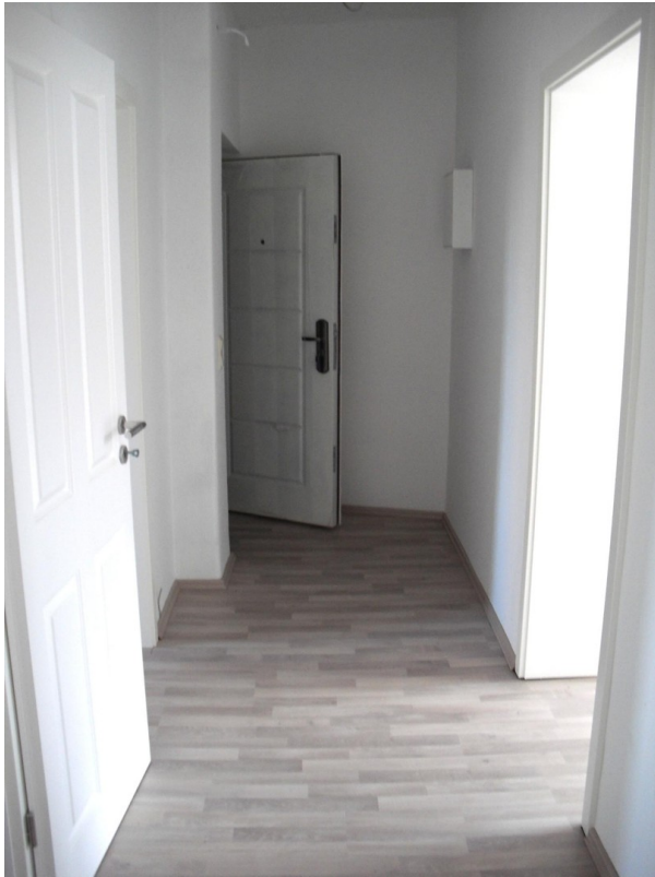
Flur mit Eingangstür