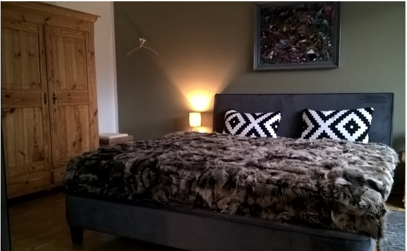
Doppelbett 180 x 200