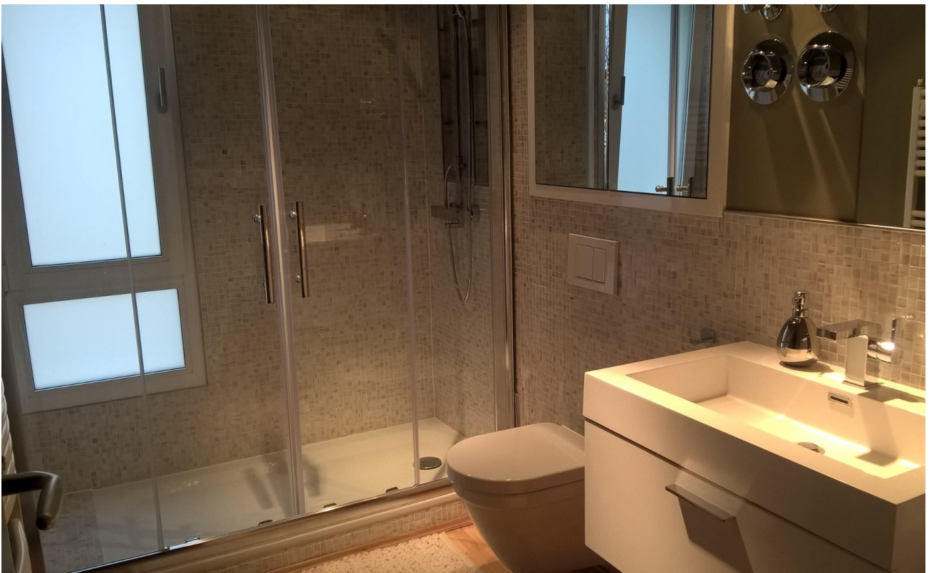
Neues Bad mit Regenwalddusche