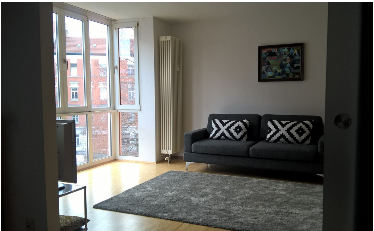
Wohnzimmer mit WIGA