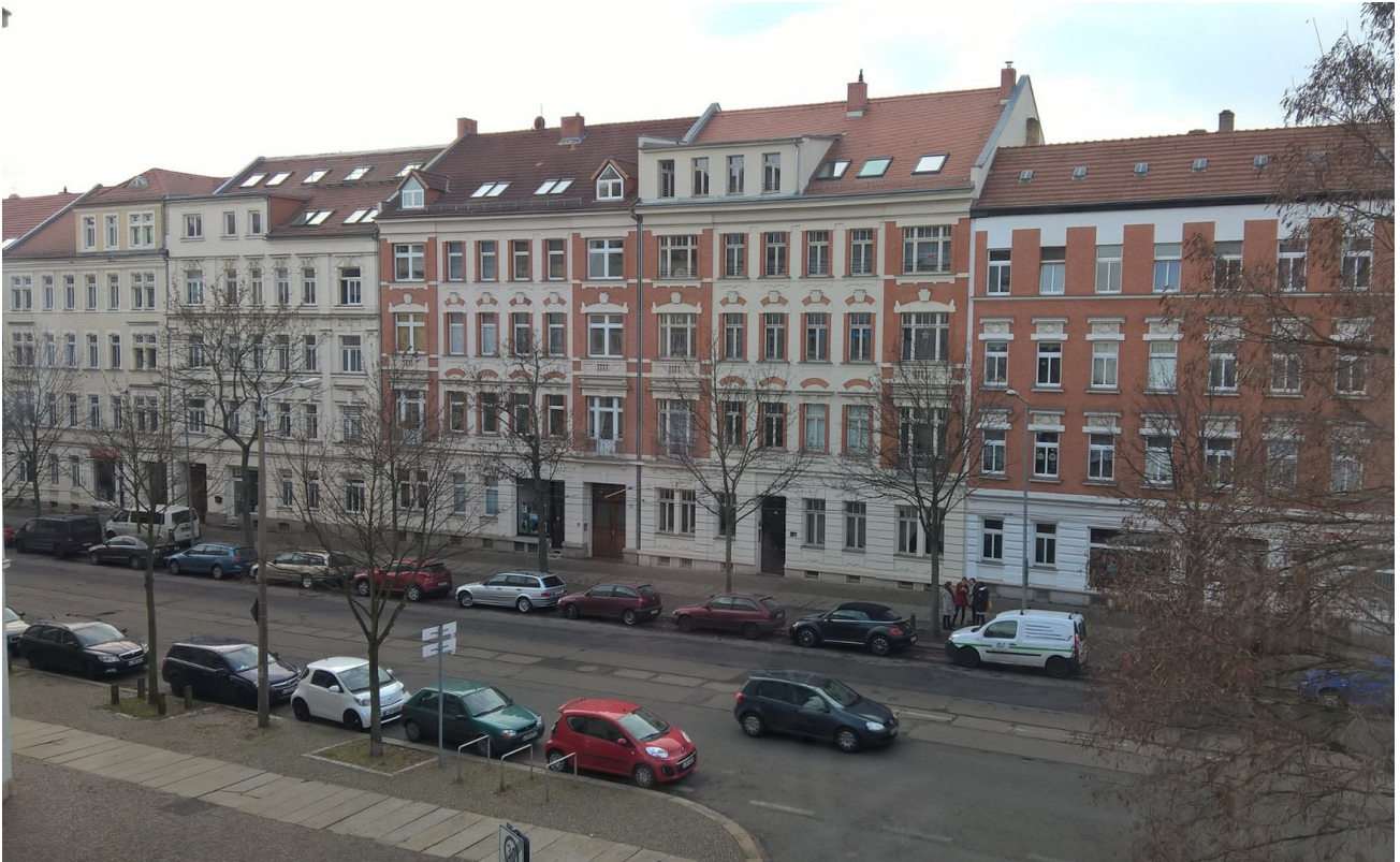
Blick nach draußen