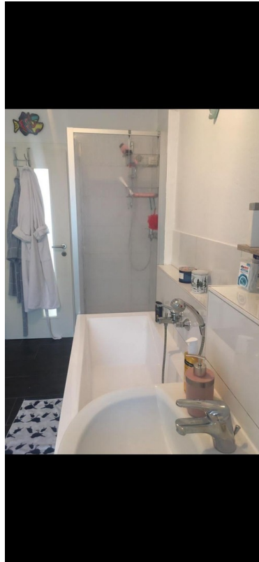
Bad / Wanne / Dusche / WC