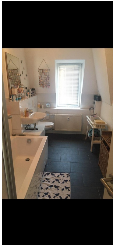
Bad / Wanne / Dusche / WC